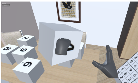
FIGURE 2: Illustration de l'environnement virtuel et de la tâche à accomplir.