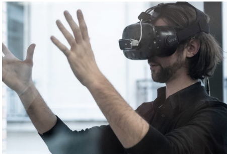
FIGURE 1: Casque HTC Vive® surmonté d'un Leap Motion® assurant l'interaction avec les mains.