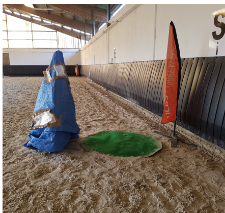
Photographies de 3 des stimuli visuels qui composent les parcours de test.

Afin de déterminer si une diminution ou une augmentation des effets de la diffusion de musique s'observe sur les paramètres comportementaux et/ou physiologiques au fil du temps, les expositions ont été répétées une fois par jour pendant 10 jours pour chacune des conditions. Il est possible que des expositions répétées à une même situation de stress induise une habitude à ce type de stress per se, diminuant ainsi progressivement son caractère stressant. Pour limiter ce risque, la position et l'ordre de présentation des stimuli varient ainsi que le trajet d'une exposition à une autre. L'objectif étant que les chevaux ne s'habituent pas à la situation de stress ce qui nous empêcherait de détecter une potentielle habitude ou sensibilisation à la musique. Pour cela, chaque stimulus a été décliné en fonction des répétitions de présentation avec la volonté d'augmenter son caractère stressant. Par exemple, lors des premiers tirs de ballon contre le pare-botte, nous le lançons 5 m devant le cheval alors qu'il marchait sur la piste, guidé par l'expérimentatrice. La déclinaison plus stressante de ce stimulus a été de le lancer derrière le cheval qui venait de passer sur la piste du manège.