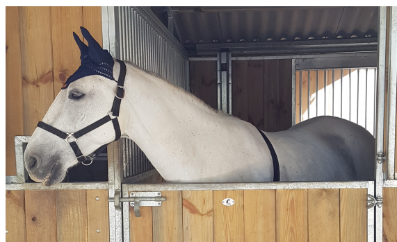
Illustration I : Equipement des individus

Composition de l'équipement des individus au cours des tests : une casque audio équipé d'un mp3 fixé à l'aide d'un licol et une ceinture de cardiofréquencemètre placée en amont de l'épaule.