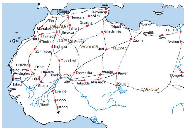
Figure 7 : Les axes transsahariens (XIII e -XV e siècle), carte de l'auteur.

Les marchands juifs acheminaient les produits d'exportation vers les portes du désert où avait lieu l'échange. Les plumes d'autruche, ainsi que d'autres produits évoqués précédemment, avaient été conduits d'Afrique noire jusqu'à ces marchés-relais du Sahara par le biais des caravanes qui suivaient les grandes pistes transsahariennes jalonnées de puits et en principe protégées [fig. 7]. Les caravanes parcouraient le Sahara en automne et en hiver, puisque la violence des vents du simoun interdisait les voyages l'été. Ces convois atteignaient des tailles parfois gigantesques, comportant plusieurs milliers de dromadaires. Il fallait compter environ deux mois de marche pour accomplir les 1 500 à 1 800 kilomètres de désert. Ceux qui importaient les produits d'Afrique noire étaient presque exclusivement des arabo-berbères ou des marchands juifs, fixés dans les villes de la lisière du Sahara, telles Sijilmassa au débouché des voies caravanières, Noul, Ouargla ou Ghadamès.