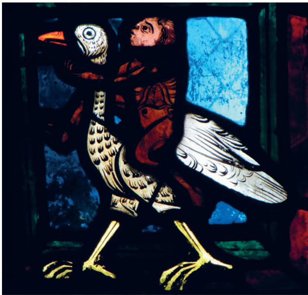
Figure 2 : parabole du Bon Samaritain, vitrail du XIII e siècle, cathédrale Saint-Étienne de Bourges, détail (en bas à droite) : homme nu chevauchant une autruche 9 .

tirées des ailes et de la queue de ces oiseaux, et étaient appréciées pour leur aspect gonflant et duveteux. Le plus prisé était le plumage des mâles, de couleur noire, mais dont le bout des ailes et la queue étaient constitués de plumes blanches. Plus larges, plus longues, mieux fournies et avec les extrémités plus touffues, les plumes des mâles étaient plus estimées que celles des femelles et des immatures, de couleur gris-brun. Les plumes étaient transformées sur leurs marchés de destination dans les mains des maîtres plumassiers qui les teignaient, les blanchissaient, les apprêtaient et les montaient 8 .