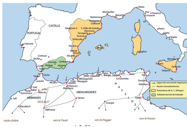
Figure 6 : Enjeux et affrontements commerciaux en Méditerranée occidentale (fin XIV e -début XV e siècle), carte de l'auteur.

pour mener à bien leurs expéditions commerciales. Le second résidait dans la politique protectionniste émanant des milieux marchands majorquins [fig.6]. Le problème essentiel était lié à la présence de ligues à Majorque qui