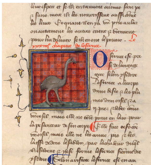
Figure 1: Jean Corbechon, Le Livre des propriétés des choses ( De proprietatibus rerum ), 1372, BnF, Français 16993, détail du feuillet 177 v .

grande île de la Méditerranée à être passée sous contrôle chrétien, dans les années 1230. Elle avait bénéficié dès sa reconquête de restrictions pontificales amoindries pour commercer avec les sultanats musulmans et, même si la politique de prohibitions pontificales avait été pratiquement abandonnée à partir de 1344 5 , Majorque jouissait toujours d'une position privilégiée, face aux terres d'islam.