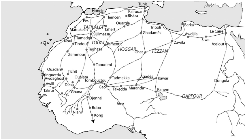
Les axes transsahariens (XIII e -XV e siècles)

Couronne catalano-aragonaise étaient connectés entre eux selon cet itinéraire commercial. Les Juifs du Touat entretenaient ainsi de vives relations avec leurs coreligionnaires de Tlemcen et d'Oran auxquels ils vendaient de la poudre d'or et des plumes d'autruche contre du blé et du cuivre 80 .