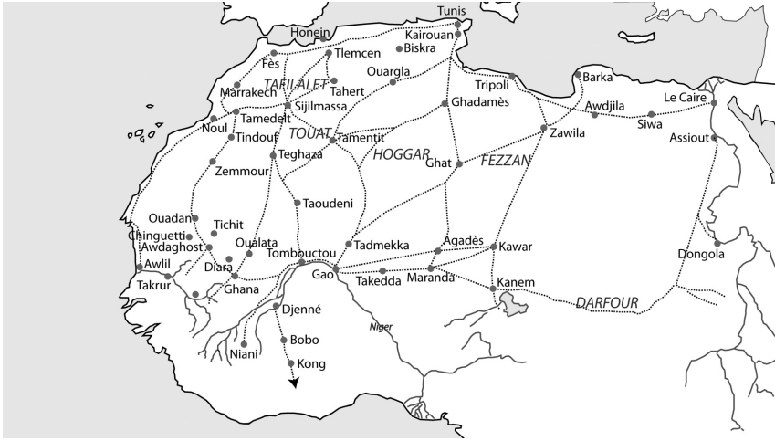
Les axes transsahariens (XIII e -XV e siècles)

Couronne catalano-aragonaise étaient connectés entre eux selon cet itinéraire commercial. Les Juifs du Touat entretenaient ainsi de vives relations avec leurs coreligionnaires de Tlemcen et d'Oran auxquels ils vendaient de la poudre d'or et des plumes d'autruche contre du blé et du cuivre 80 .