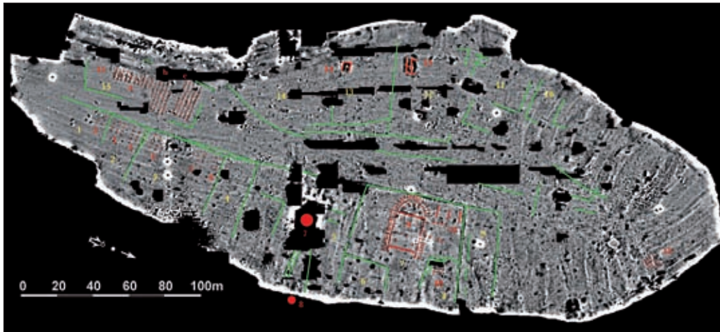
Fig. 2 - Magnétogramme du plateau supérieur du mont Lassois (H. von der Osten, service des fouilles du Bade-Wurtemberg).