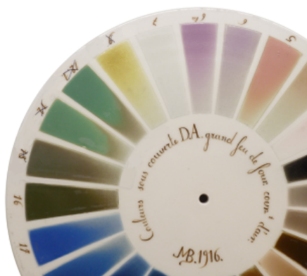
Figure E1 : Exemple de palette de décors de la manufacture de Sèvres.

Au cours du 19 ème siècle, les recherches à la manufacture sur la synthèse des minéraux s'intensifient afin d'obtenir des poudres colorées pour les décors de porcelaine, amenant Jacques-Joseph Ebelmen à découvrir la croissance cristalline par la méthode des flux en 1847. Les minéraux composés de chrome, dont principalement les spinelles, font l'objet d'un intérêt particulier, en raison de la riche palette de couleurs qu'ils offrent (Figure E1).