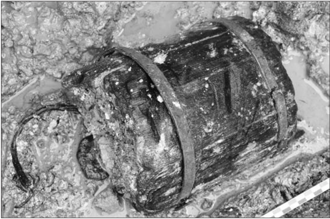
Fig.2 : Photo en cours de fouille du seau en bois et fer