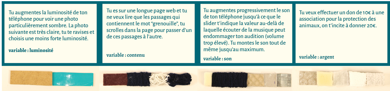
Figure 1: Prototypes basse fidélité de variateurs linéaires donnant une information tactile aux utilisateurs. Ces prototypes ont été réalisés par les participants de la 2 nde expérience, et correspondent aux scénarii présentés au-dessus.

Sandra Parriaud 1 , Valentine Reynaud 1,2 , Jean-Baptiste Joatton 1 , Sybille Caffiau 3 , Céline Coutrix 3 1 Pôle Supérieur de Design Léonard de Vinci Villefontaine, France parriaud.sandra@gmail.com, jean-baptiste.joatton@ac-grenoble.fr 2 Institut de recherches philosophiques de Lyon, Université Jean Moulin Lyon 3, Lyon, France valentine.reynaud@gmail.com 3 Université Grenoble Alpes, CNRS Grenoble, France Prenom.Nom@univ-grenoble-alpes.fr