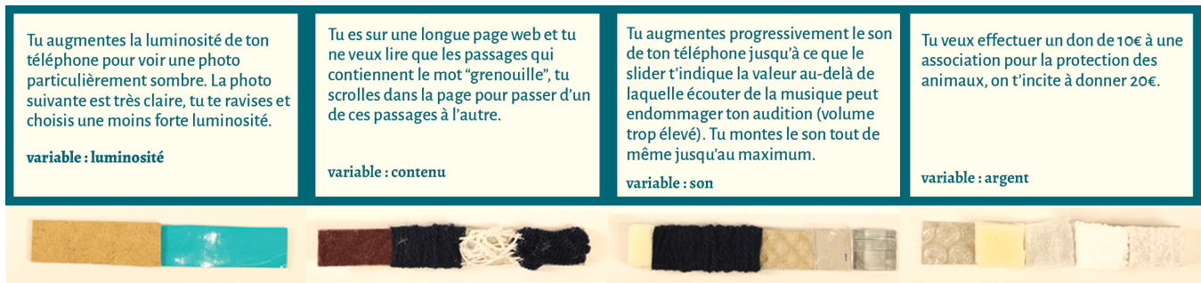
Figure 1: Prototypes basse fidélité de variateurs linéaires donnant une information tactile aux utilisateurs. Ces prototypes ont été réalisés par les participants de la 2 nde expérience, et correspondent aux scénarii présentés au-dessus.