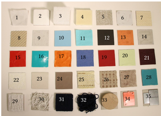
Figure 2 : Collection d'échantillons physiques.

Chaque échantillon est présenté sous la forme d'un carré de 6×6cm, collé en plusieurs points sur du carton, afin d'être facilement pris en main mais aussi frotté par le doigt pour palper son élasticité.