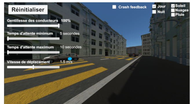
Figure 1. Point de vue externe de la simulation avec paramètres de contrôles. Le point bleu indique ce qui est regardé par l'utilisateur.

Un travail plus récent (2015) a aussi investigué un scénario similaire (toujours avec 6 enfants atteints de TSA) mais en utilisant un environnement immersif de type CAVE [15]. Les résultats ont montré que la plupart des enfants (4 sur 6) ont pu atteindre l'objectif d'apprentissage