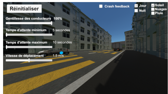
Figure 1. Point de vue externe de la simulation avec paramètres de contrôles. Le point bleu indique ce qui est regardé par l'utilisateur.

Un travail plus récent (2015) a aussi investigué un scénario similaire (toujours avec 6 enfants atteints de TSA) mais en utilisant un environnement immersif de type CAVE [15]. Les résultats ont montré que la plupart des enfants (4 sur 6) ont pu atteindre l'objectif d'apprentissage