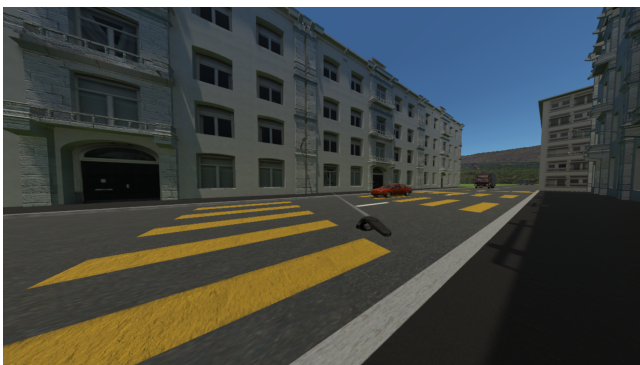
Figure 3. Point de vue du participant dans la simulation.

Pour résumer, les études existantes qui concernent l'utilisation de la VR pour l'apprentissage de nouvelles capacités montrent des conclusions encourageantes. Toutefois, la plupart de ces études se focalisent sur un groupe très spécifique de participants (souvent atteints de TSA) et le nombre limité de participants aux études et des résultats parfois contradictoires montrent le besoin des recherches supplémentaires. En outre, au meilleur de notre connaissance, aucune étude n'a encore investigué l'acceptabilité de la VR basée sur un casque immersif avec des jeunes adultes avec DI (10-18).