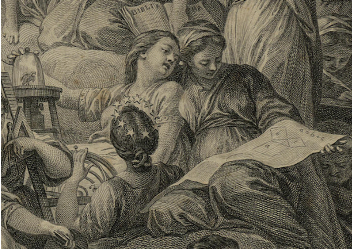
Détail du Frontispice : l'Astronomie en compagnie de la Géométrie et de la Physique.

Pour les lecteurs postérieurs à 1772, date à laquelle le frontispice de l' Encyclopédie , gravé par Cochin, est envoyé aux souscripteurs qui le font insérer dans le premier volume, l'Astronomie se trouve aux pieds de la Vérité dévoilée par la Raison et la Philosophie, en compagnie de la Géométrie et de la Physique. Cette proximité est à l'image de la présentation des sciences que D'Alembert donne au début du « Discours préliminaire des éditeurs », d'un point de vue qu'il appelle encyclopédique, c'est-à-dire explicitant l'ordre et l'enchaînement des connaissances humaines :