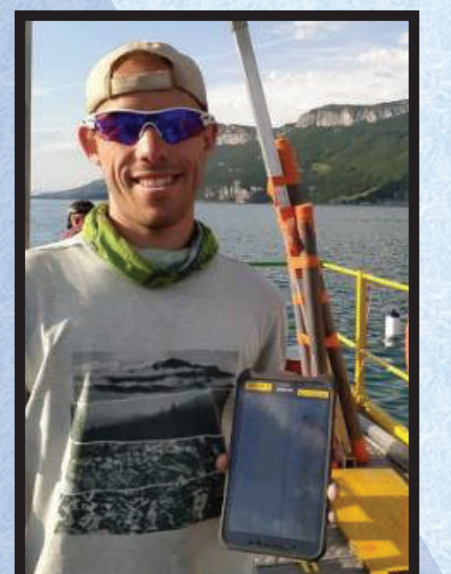
PI et Carotteur heureux !