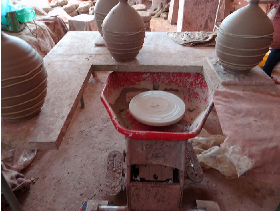
Figure 13 – Tour de potier électrique.