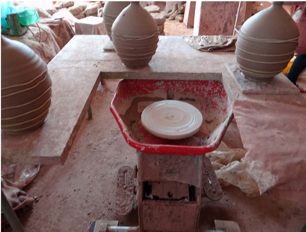
Figure 13 – Tour de potier électrique.