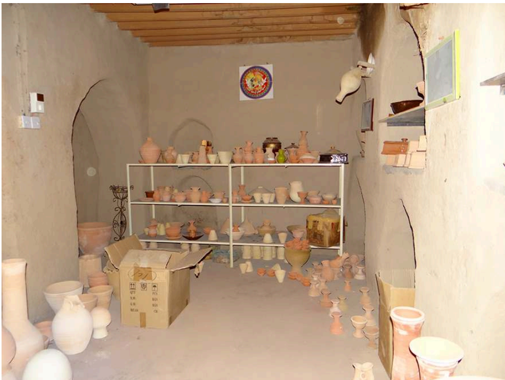
Figure 5 – Lieu d'exposition de la céramique, 2014.