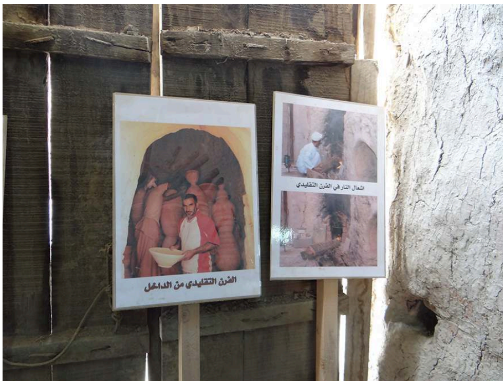
Figure 18 – Exposition photographique.