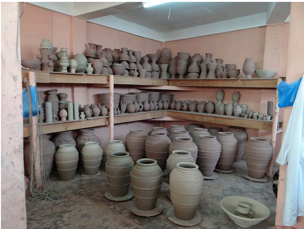
Figure 14 – Céramique en cours de séchage.