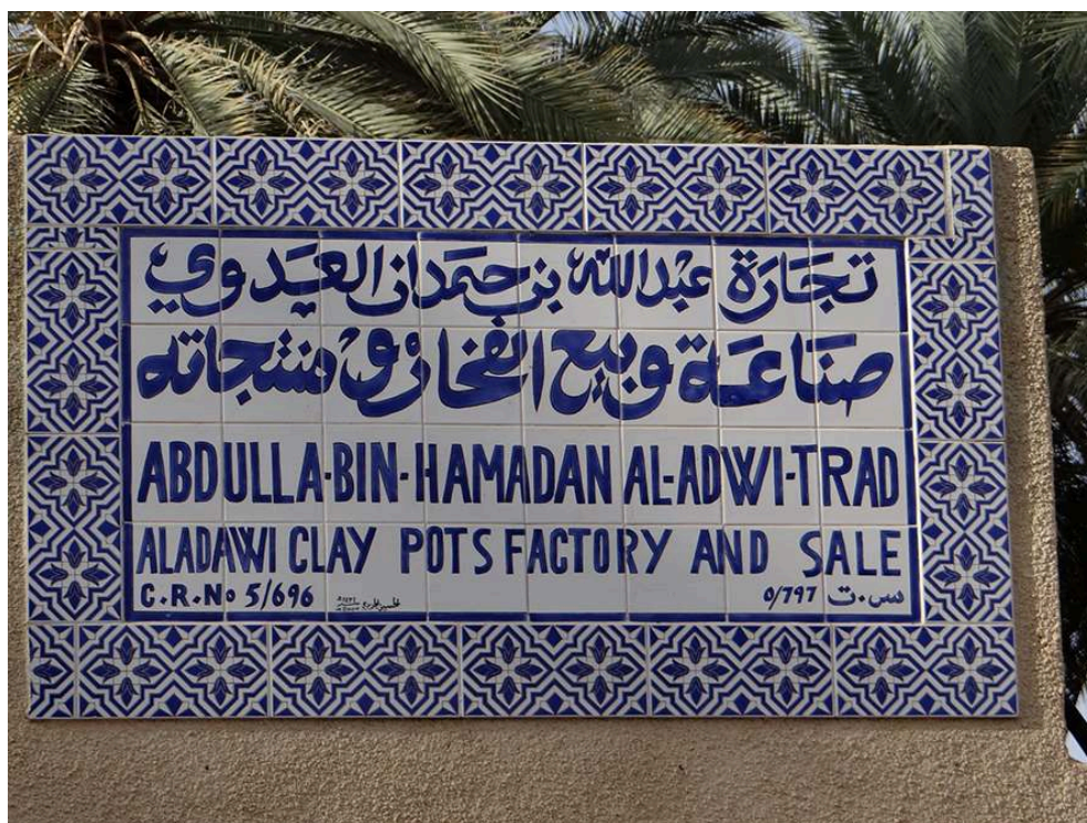
Figure 2 – Enseigne de l'atelier, 2014.