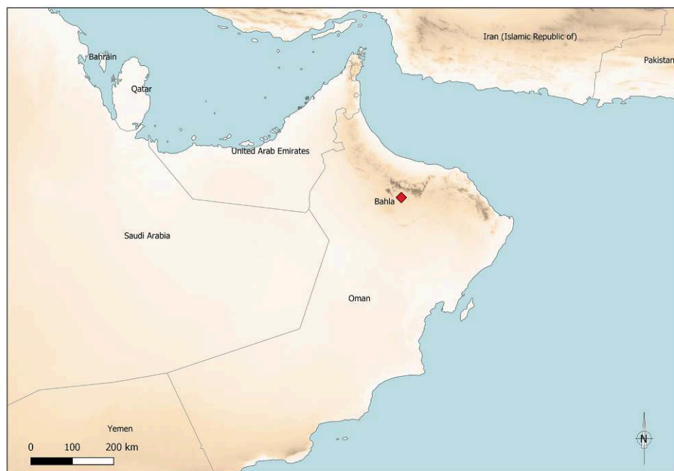
Figure 1 – Localisation de Bahla.