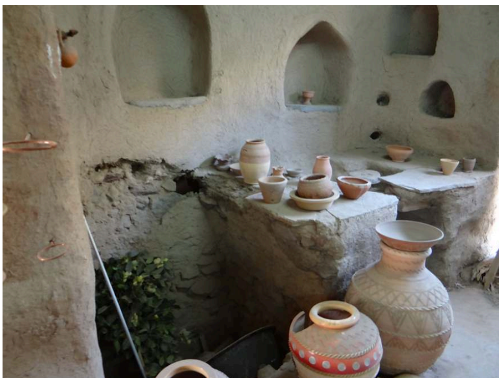
Figure 6 – Fosse de pourrissement de l'argile et le tour de potier.