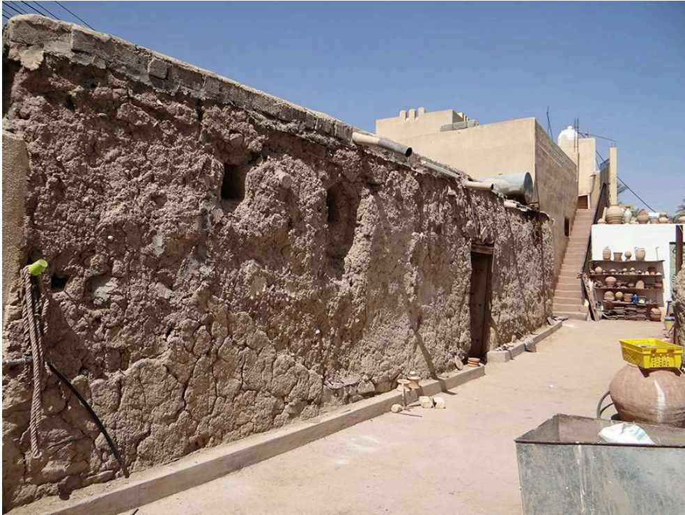
Figure 4 – Ancien atelier en premier plan, 2016.