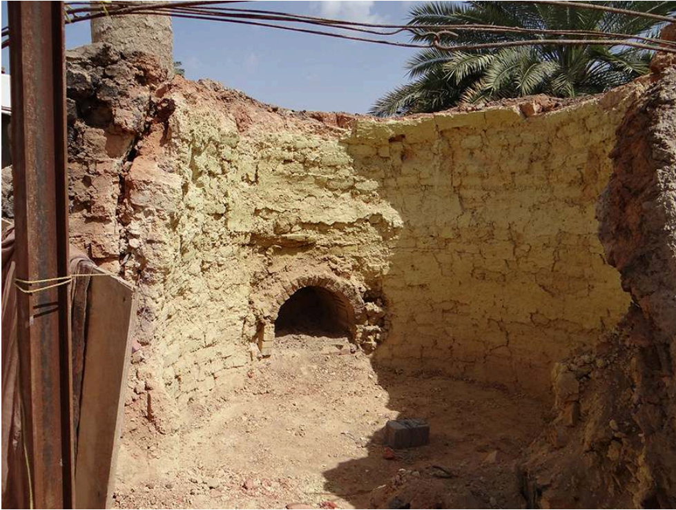
Figure 9 – Nouveau four circulaire endommagé.