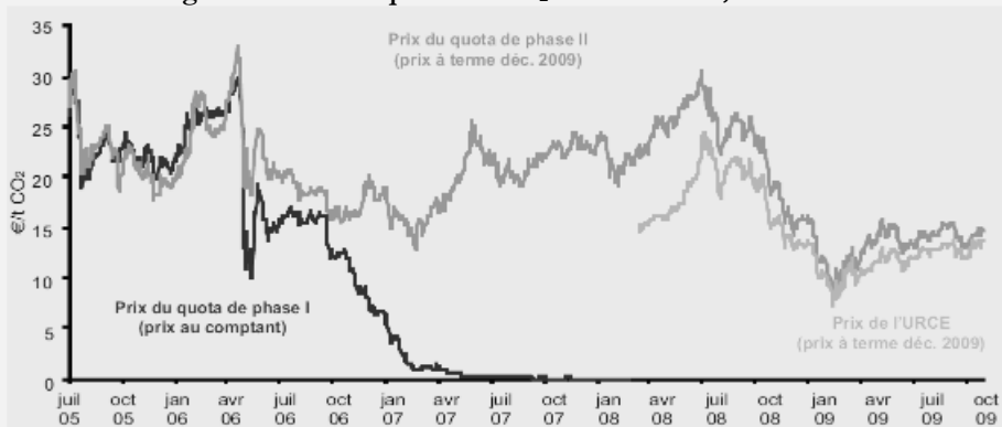
Figure 3 : Prix du quota de CO 2 et de l'URCE, 2004-2009

URCE : unités de réduction des émissions (unité de transaction du mécanisme de développement propre (MDP)).