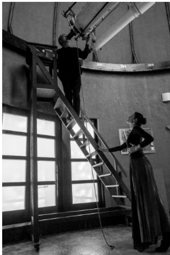
Figure 2 – Extrait du court métrage sous la coupole de l'observatoire de Lille.