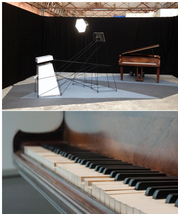
Figure 1 – Pour As We Are Blind , Véronique Béland a transformé un piano quart-de-queue en piano mécanique.

Le capteur et son traitement informatique ne seront pas détaillés ici. À partir des données captées, ils produisent une couleur principale, et potentiellement une couleur secondaire, choisies parmi sept. Cette paire de couleurs (comme orange/violet ) est transmise à la fois à l'éclairage ambiant, au module de production d'image (qui génère une photographie,