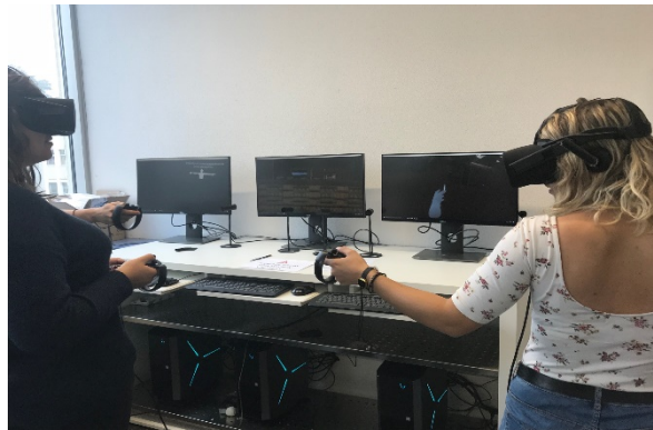
Image 2 : Représentation d'étudiantes équipées de casques 3D interagissant dans un EVI via leur avatar.