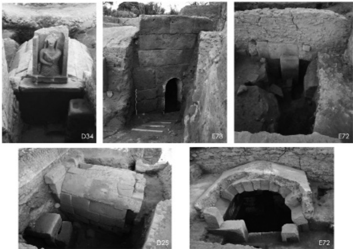
Fig. 2 - Cuma. Tombe a camera con volta a botte. Esterni.