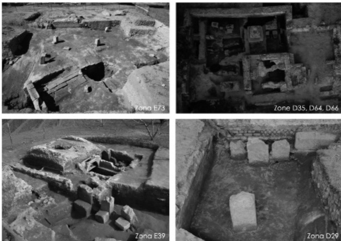
Fig. 4 - Cuma. Settori della necropoli della Porta Mediana con contesti di II-I secolo a.C. (© Archivio CJB, CNRS-EFR).