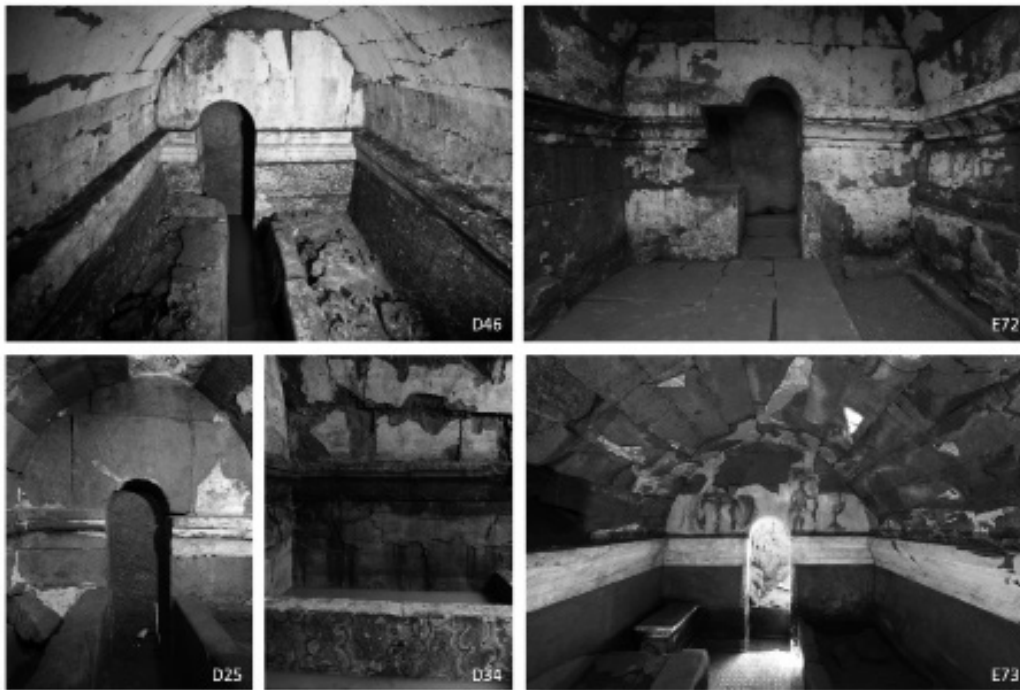
Fig. 3 - Cuma. Tombe a camera con volta a botte. Interni.