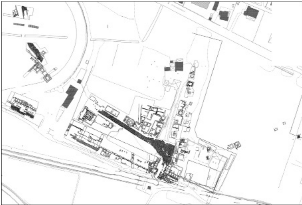
Fig. 1 - Cuma. Pianta della necropoli della Porta mediana (G. Chapelin, CJB, CNRS-EFR).