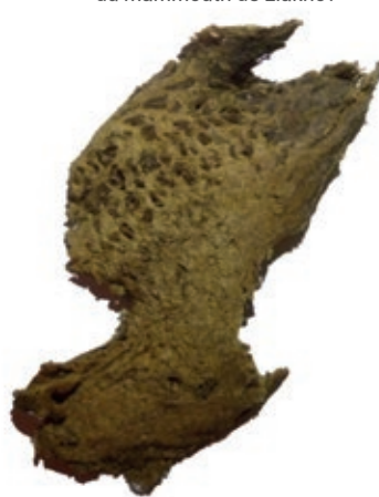
Fragment de peau du mammouth de Liakhov