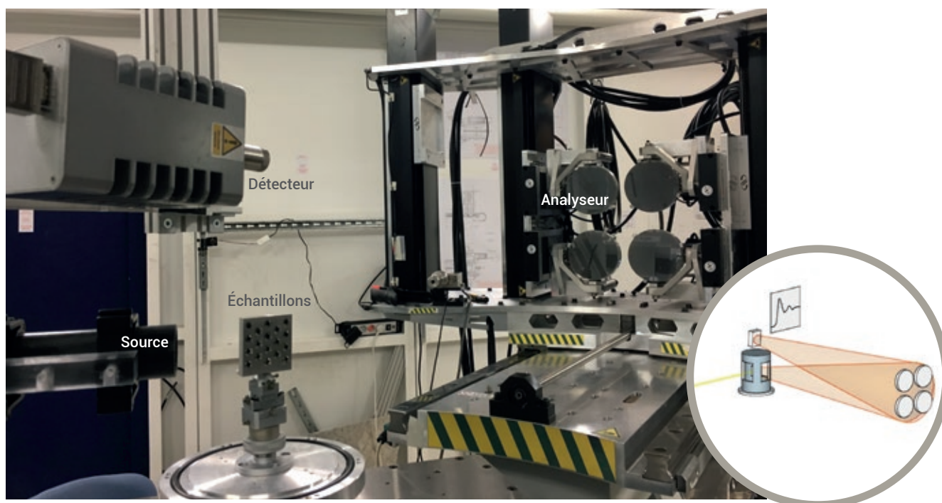
1. Exemple de dispositif d'analyse par diffusion Raman des rayons X (ici sur la ligne GALAXIES du synchrotron SOLEIL) et schéma de principe. Le faisceau diffusé est détecté par l'intermédiaire d'un analyseur à cristaux (ici, à quatre cristaux) qui permet de sélectionner précisément l'énergie des rayons X détectés. Il est en effet essentiel de connaître précisément la perte d'énergie dans l'échantillon pour déterminer sa composition, ce qui requiert une grande précision dans la définition des énergies des rayons X incidents et des rayons X détectés.

avec la matière. Cependant, la faible énergie de liaison des électrons des couches internes des éléments les plus légers du tableau périodique (jusqu'au soufre) pose une limite fondamentale à leur étude en spectroscopie XANES. Cette énergie se trouve dans la gamme dite des rayons X « mous », entre la centaine d'électronvolts (eV) et quelques kiloélectronvolts (keV) : le carbone a un seuil d'absorption des rayons X, seuil d'éjection des électrons 1s, vers seulement 280-320 électronvolts, une énergie trente fois plus faible que celle du cuivre [1, 2]. Or, la forte absorption des rayons X par la matière dans cette gamme impose des contraintes expérimentales particulièrement fortes. À ces énergies, les rayons X ne peuvent traverser plus de quelques centaines de nanomètres de matière, cent fois moins que le diamètre d'un cheveu !