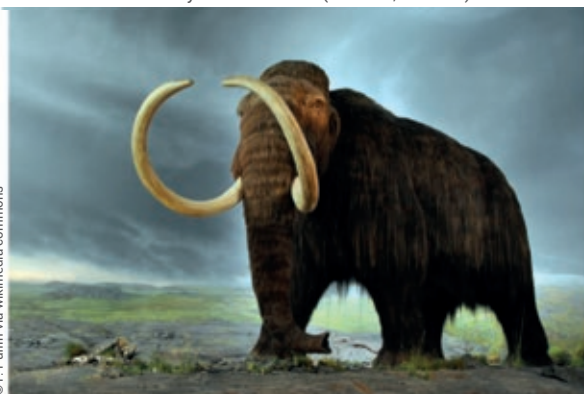
Reconstitution d'un mammouth laineux au Royal BC Muséum (Victoria, Canada)