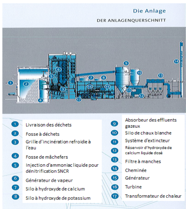
Photo 2. Le processus industriel d'incinération