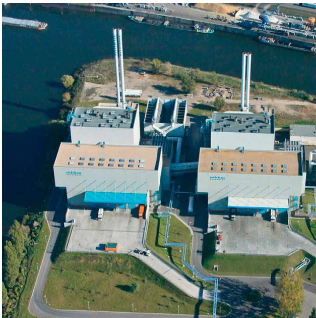
Photo 1. La MHKW vue du ciel

Comme la quasi-totalité des villes de l'Est de l'Allemagne, la ville de Magdeburg a été marquée par la forte tradition du chauffage urbain, dont le réseau a été principalement développé dans les années 1970. L'histoire du chauffage urbain à Magdeburg a cependant connu une forte évolution durant la décennie 2000, qui s'est concrétisée par des changements infrastructurels importants et notamment le développement d'interconnexions entre services locaux. La plus notable s'est matérialisée dans la construction d'une nouvelle infrastructure alimentant le réseau de chauffage à partir de ressources locales et non plus lointaines et fossiles, l'incinérateur du quartier de Rothensee, appelé MHKW (pour Müllheizkraftwerk , incinérateur de déchets) (photo 1). Depuis 2006, cet incinérateur, dont le financement s'est fait par des montages complexes dans un