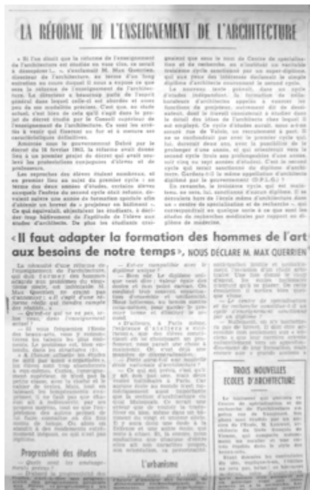
Fig. 3 : Interview de Max Querrien, Le Monde, 20 janvier 1965.