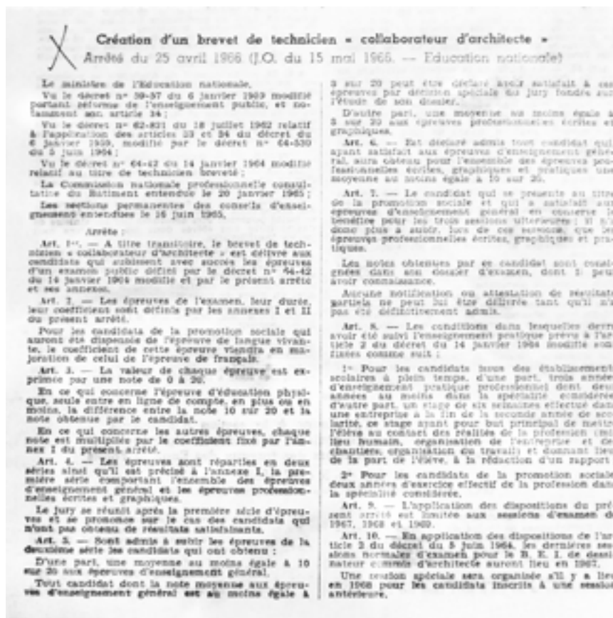
Fig. 2 : Arrêté du 25 avril 1966 du ministère de l'Éducation nationale créant un brevet de technicien « collaborateur d'architecte ».

exercice professionnel — sont introduits dès 1966 des cours d'histoire de l'art et de sociologie pensés pour de futurs collaborateurs d'architecte. Sur proposition des syndicats du personnel des cabinets d'architectes, l'enseignement du dessin d'architecture réduit dans un premier temps à la technique d'exécution peut finalement, « dans certains cas limités », faire « appel à l'esprit d'invention de l'élève » et être étendu à « certaines notions de composition 16 ». Une année supplémentaire passe avant la parution du décret, le 25 avril 1966, créant le brevet de technicien de collaborateur d'architecte de l'Éducation nationale (fig. 2).