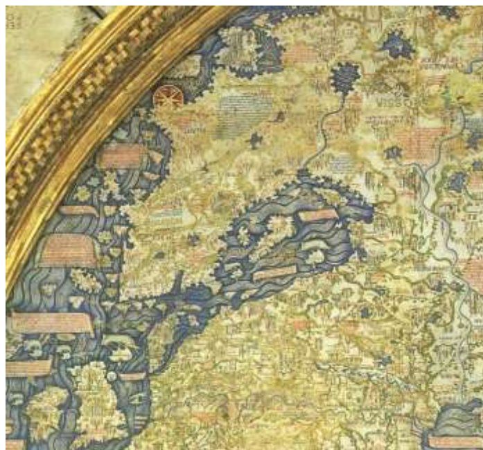
Fig. 1 Scandinavia în mapamondul venețian al lui Fra Mauro (1450), detaliu (realizat în perspectivă inversă, cu nordul situat în partea inferioară)

Sintetizând informațiile despre nordul Europei ajunse astfel la Veneția, mapamondul lui Fra Mauro, din Ordinul camaldulez, realizat în jurul anului 1450, al cărui original este conservat în prezent la Biblioteca nazionale Marciana, plasa astfel cât se poate de firesc Dacia la nord de Germania, cu precizarea în legendă: Dacia e parte in isola e in tera fermo e confina cum Alemagna bassa 92 . Prin tipărirea rapoartelor misiunii lui Pietro Querini de către Ramusio în Navigazioni et viaggi , reprezentarea Daciei nordice avea să domine încă multă vreme spiritele cultivate ale Europei latine începând de la mijlocul sec. al XVI-lea încolo, grație circulației acestei lucrări populare și accesibile (prin utilizarea limbii vernaculare). Fără să anticipăm prea mult, se poate vedea prin ce mecanisme intelectuale tocmai Veneția, departe de a „crea” în mod inopinat vreo Dacie danubiană, va promova dimpotrivă cu energie ideea unei Dacie baltice chiar și după „suprimarea” oficială a acesteia în 1537, prin ordinul regelui danez Cristian al III-lea.