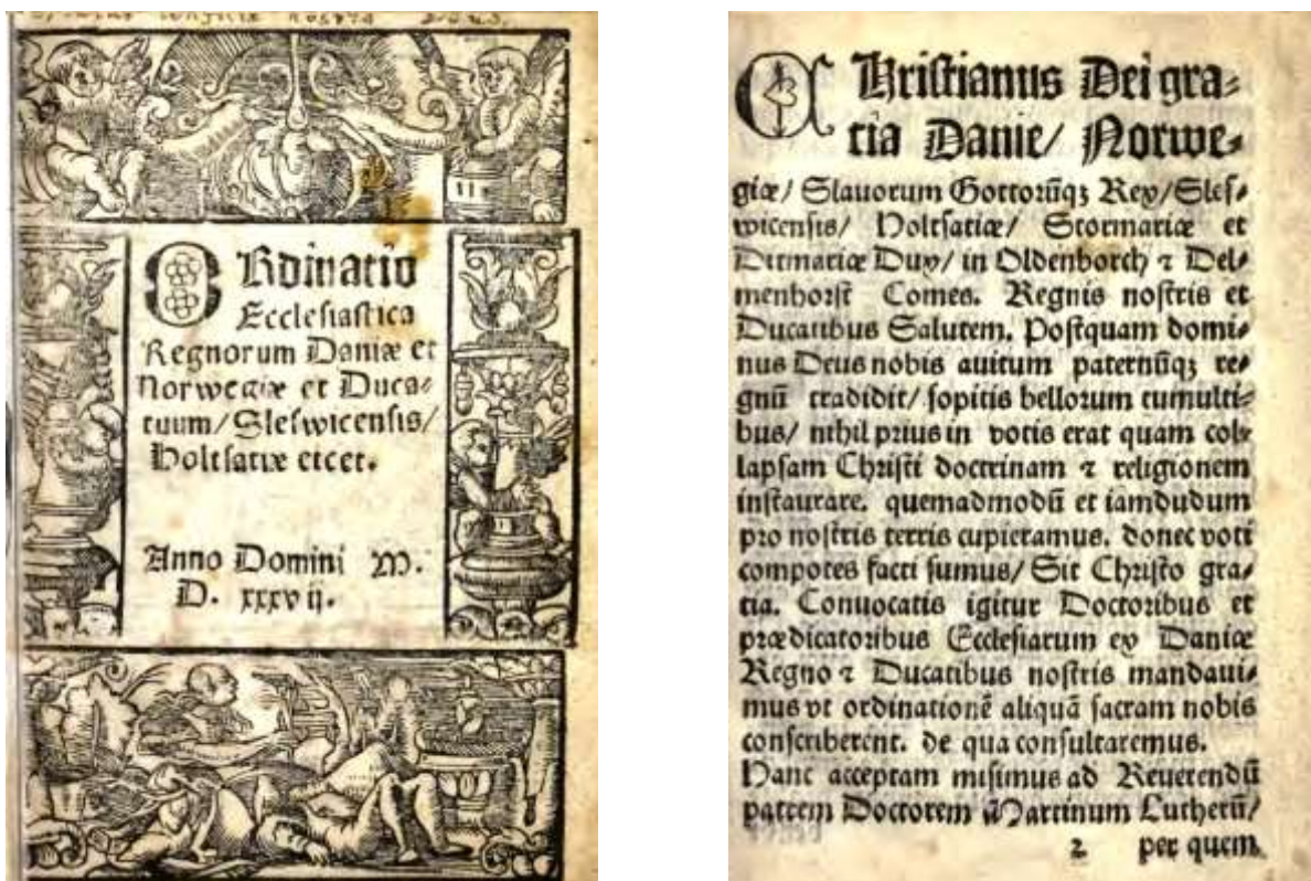
Fig. 5 Coperta și f. 1v a Ordinatio ecclesiastica regnorum Daniae et Norwegiae (Copenhaga, 1537), elaborată de Johannes Bugenhagen și promulgată de Christianus [III] Dei gratia Danie, Norwegiae, Slauorum Gottorumque Rex...