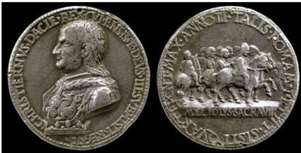
Fig. 2 Cristian I rex Dacie pe medalia festivă a lui Bartolomeo Melioli din Mantova (1474), Londra, British Museum

că înfrângerea din 1471 nu era decât tranzitorie și că, pe termen lung, dominația sa legitimă trebuia să fie acceptată și de Suedia. Ele exprima astfel mai mult un proiect de guvernare viitor decât o descriere a stării de fapt. Se poate deci deduce că regele Daciei s-a deplasat atât de departe pentru restaurarea dominației sale atât de aproape: în Suedia. Chiar și pentru a rezolva o problemă la capătul nordic al Christianitas , regele Daciei înțelesese perfect că toate drumurile duceau la Roma.