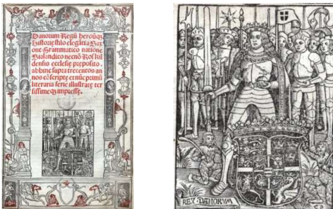
Fig. 4 Cristian al II-lea rex Danorum pe coperta lucrării Danorum regum heroumque historiae a lui Saxo Grammaticus, publicată la Paris în 1514 de Christiern Pedersen