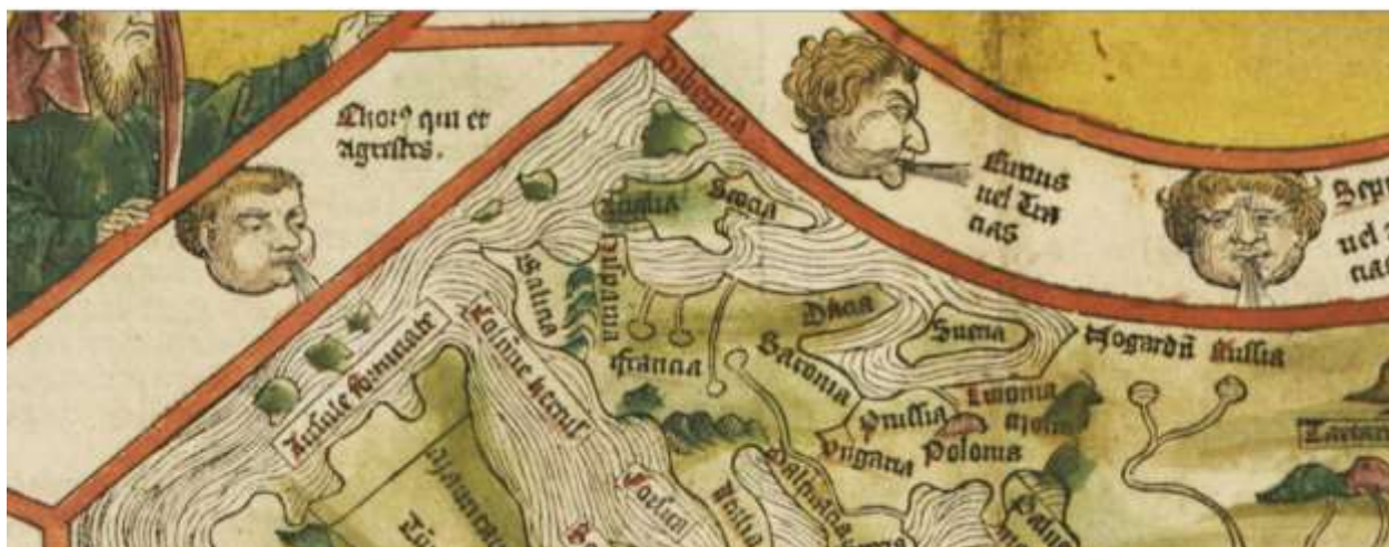
Fig. 6 Dacia baltică în Mapamondul lui Hartmann Schedel, Liber chronicarum (1493), detaliu

Jutlanda supradimensionată, la nordul Saxoniei , având la vest și la est Scotia respectiv Suetia concepută ca o insulă 354 .