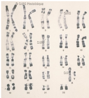
Caryotype humain mâle réalisé à partir d'observations des 23 paires de chromosomes au microscope. Photothèque CNRS Référence N° : 19890001_0088 © CNRS Photothèque

Davey JW, et al. 2016. Major improvements to the Heliconius melpomene genome assembly used to confirm 10 chromosome fusion events in 6 million years of butterfly evolution. G3 (Bethesda) 6:695-708.