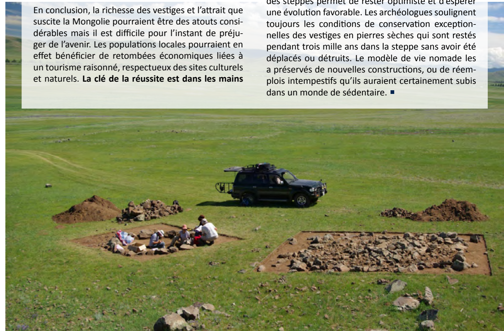
Fig. 4 : fouilles archéologiques de Tsatsyn Ereg, photo J. Magail, 2010

de l'ensemble des acteurs politiques, administratifs et civils. Le programme de la mission archéologique conjointe Monaco - Mongolie est un projet à long terme qui se construit année après année avec les autorités nationales et locales. La création d'emplois d'agents du patrimoine dans la province de l'Arkhangai devrait être la prochaine étape importante dans l'encadrement des visites des sites archéologiques. Un prélèvement tout à fait modeste sur le montant que paie chaque touriste pour découvrir la province contribuerait sans aucun doute à les rémunérer. L'agent du patrimoine qui guide les visiteurs le long de l'itinéraire profite de la visite pour contrôler l'état des sites archéologiques. L'attachement des Mongols à leur patrimoine et à leur identité de peuple des steppes permet de rester optimiste et d'espérer une évolution favorable. Les archéologues soulignent toujours les conditions de conservation exceptionnelles des vestiges en pierres sèches qui sont restés pendant trois mille ans dans la steppe sans avoir été déplacés ou détruits. Le modèle de vie nomade les a préservés de nouvelles constructions, ou de réemplois intempestifs qu'ils auraient certainement subis dans un monde de sédentaire. ■