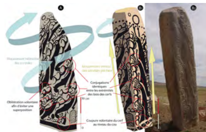
Fig. 2 : stèle pierre à cerfs

culture. Ce sont les Khunnu (Xiōngnú - 匈奴) au III e siècle av. J.-C. qui vont véritablement marquer l'identité de ces peuples avec la formation du Premier Empire des steppes opposé au Premier Empire de Chine. L'archéologie mongole a développé aussi beaucoup plus d'énergie à étudier cette période au détriment peut-être des périodes précédentes également très riches en vestiges archéologiques. Aussi, les nombreuses nécropoles de la fin de l'âge du Bronze ne furent pas la seule surprise des missions scientifiques travaillant sur la protohistoire. L'art rupestre sur rocher mais également sur les stèles nommées « pierres à cerfs » s'est avéré être une source d'informations importante sur le bestiaire et l'armement de ces nomades. Les cervidés gravés sur ces menhirs de granite, représentés bondissants, appartenaient jusqu'à présent exclusivement à un registre connu des chercheurs, celui des tribus scythes du VI e siècle avant notre ère (fig.2).