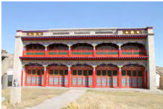
Fig. 3 : bâtiment est restauré du Monastère – musée Zayain Khuree, ville de Tsetserleg, photo J. Magail, 2011

La création d'itinéraires culturels est une méthode utilisée dans le monde entier pour intéresser les visiteurs à un thème patrimonial particulier. En s'appuyant sur les infrastructures existantes, un itinéraire peut se mettre en place relativement facilement dans un pays européen, mais en Mongolie, l'ensemble de la logistique indispensable à l'accompagnement de groupes dans la steppe est à la charge de l'opérateur. Le développement d'un tourisme culturel nécessite donc une forte implication des autorités locales et nationales. Aussi, lorsque le gouverneur de Tsetserleg a inauguré le premier office de tourisme en 2011, il a montré un premier engagement concret dans l'accueil des voyageurs. Dans cette même ville, le monastère, actuellement musée régional très fréquenté par les touristes, devient un pôle muséal destiné à préparer les groupes à la visite des sites anciens situés dans la steppe (fig.3).