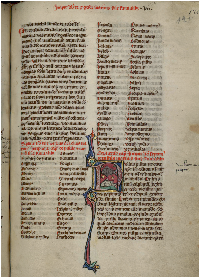
Thomas de Cantimpré, Liber de natura rerum (XII e siècle), Médiathèque Simone Veil de Valenciennes, ms. 320, f. 121r

monstrum 23 –, rien ne semble permettre de comparer l’animal décrit au xifius , que le nom conduit à identifier à l’espadon, d’après le grec ξιφίας, « épée, espadon » : l’équivalence entre xiphias et gladius « épée », d’où « espadon », est indiquée par Pline 24 . Mais le sens du nom n’est pas rappelé par Thomas, si bien que la principale caractéristique de ce poisson – son long rostre – n’apparaît pas dans la notice. Si Thomas n’a puisé qu’à l’ Hexaméron de Basile le Grand – seule autorité invoquée –, il n’avait aucune