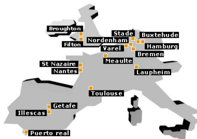
Carte 1 Les principaux sites de production d'Airbus SAS en 2006