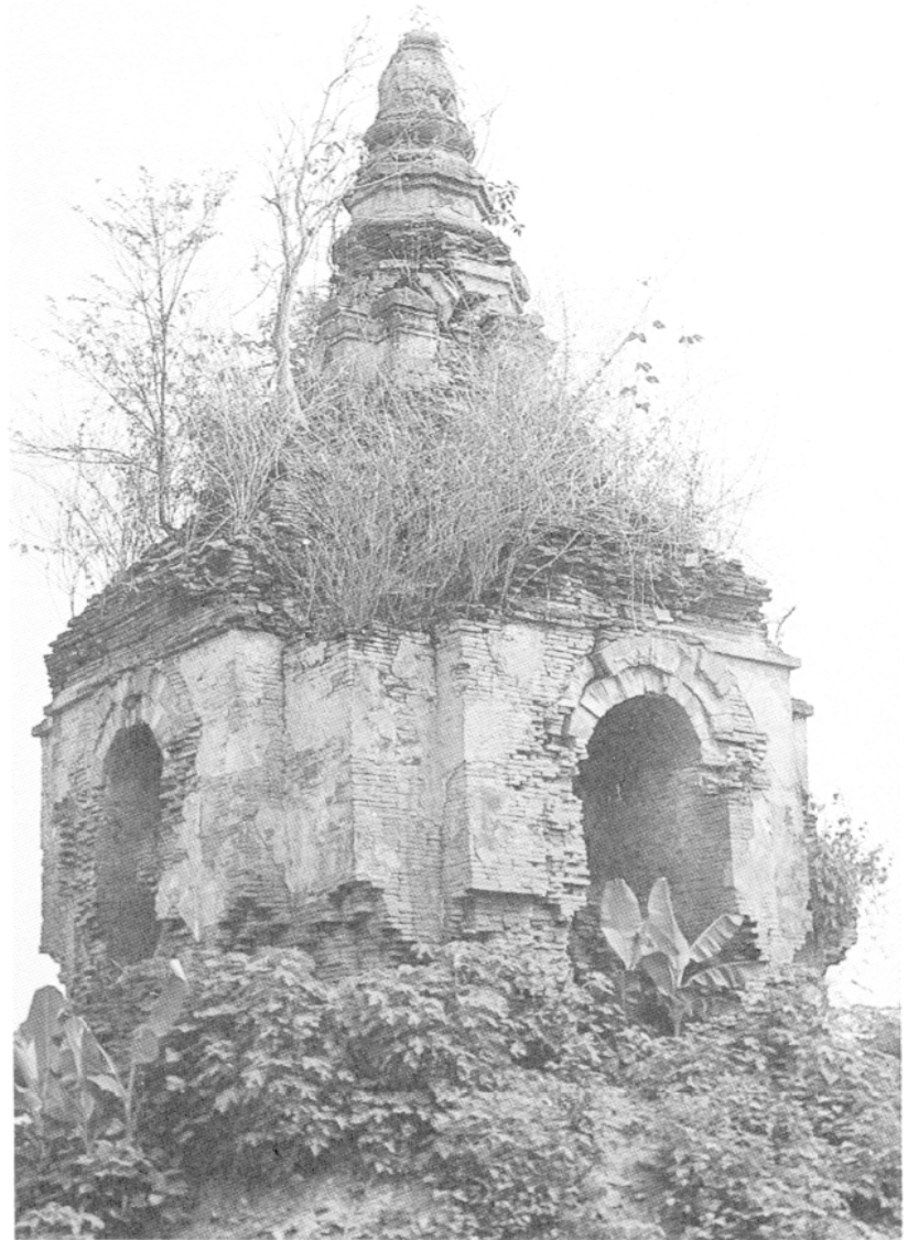
2 – Pha That Cai Muang, temple de plan carré situé entre Ban Don That et Ban Hom

un examen stylistique sommaire des ruines visibles, que ces monuments relèvent sans conteste de la culture de Chiang Saen. Si l'on se base sur l'état actuel des constructions les plus importantes, on peut également conclure, sans grand risque d'erreur, qu'ils datent de la période la plus faste du royaume de Lān Nā, c'est-à-dire du XV e et du XVI e siècles 16 . On se situe donc là dans une période relativement récente, bien loin en tout cas des faits mythiques évoqués dans la Chronique de Souvanna Khom Kham . Il reste à résoudre la question fondamentale des rapports historiques entre la cité de Chiang Saen, telle qu'elle fut délimitée à l'intérieur de ses murs et d'autres zones de concentration de population, toutes proches, dont une partie importante était située sur la rive gauche du Mékong.