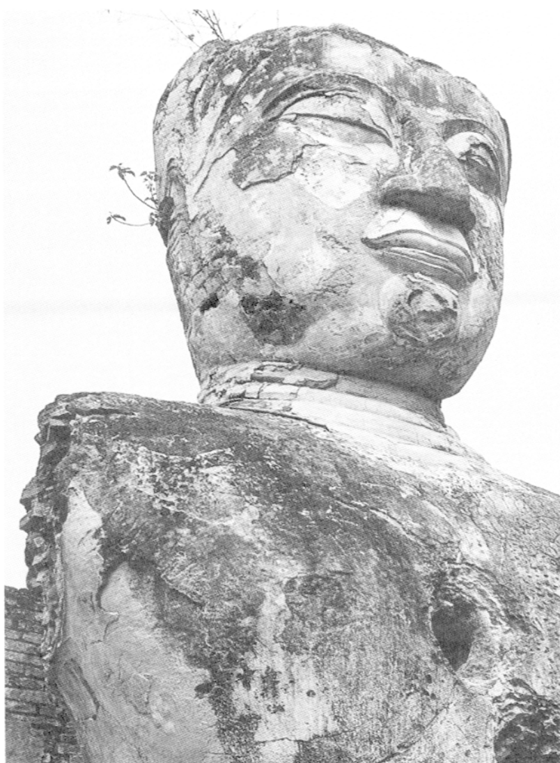
1 – Pha Ong Luang, statue monumentale du Bouddha située entre Ban Don That et Ban Hom