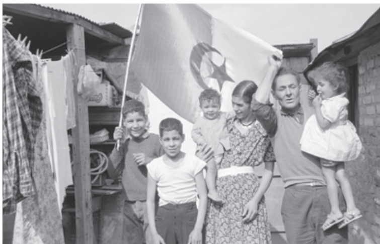
Photographie de Monique Hervo, issue d'une série de clichés pris au moment de l'indépendance de l'Algérie dans le bidonville de Nanterre. Fonds Monique Hervo, Coll. BDIC.