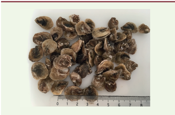
Figure 1. Jeunes huîtres creuses Crassostrea gigas .