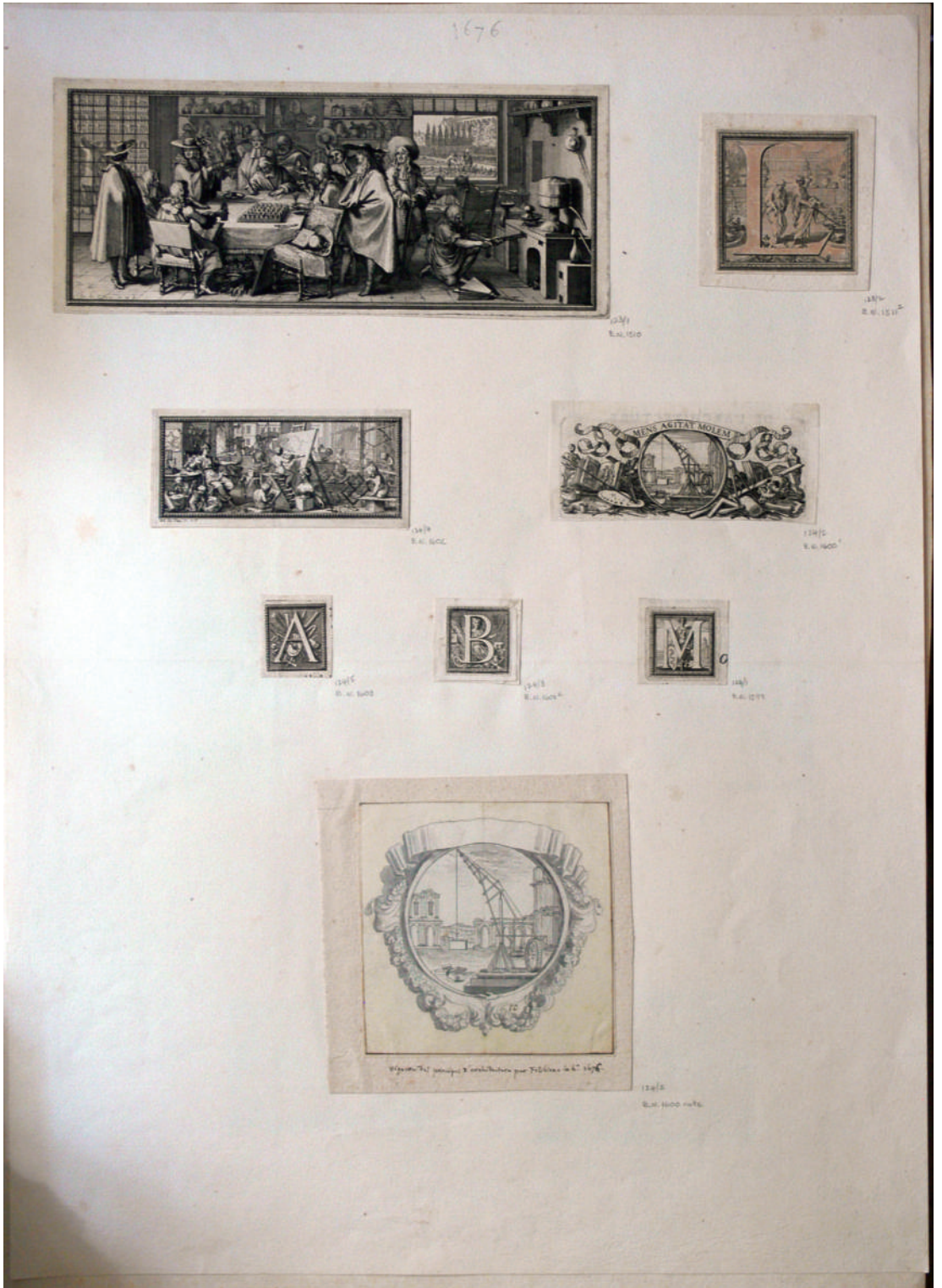
III. 2. Une planche de l'œuvre de Sébastien Leclerc constitué par Ch.-A. Jombert, mélangeant estampes de tous types (y compris pour le livre) et dessins, souvent préparatoires. BnF, Estampes, Réserve Ed-139-boîte fol.