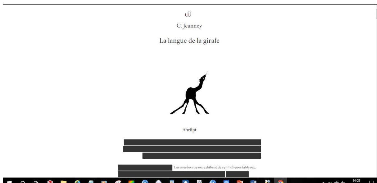
Figure 3. Capture d'écran de l'antilivre dynamique La langue de la girafe de C.Jeanney

Il existe deux types d'antilivre. Le premier dit « statique » correspond à un livre numérique classique disponible en pdf, le second, l'antilivre dit « dynamique » en html offre une expérience de lecture à la fois ludique et interactive conçue spécifiquement pour chaque ouvrage. Pour illustrer ce propos, le format antilivre dynamique de La langue de la girafe de Chrisitne Jeanney, se présente sous la forme d'un texte caviardé dont les fragments se dévoilent un à un au survol du curseur. Il s'agit de mettre en exergue la technique sur laquelle s'appuie la construction du texte, le collage, tout en proposant une lecture qui repose sur la concentration du lecteur à la manière d'un jeu de mémoire. Ce format étant qualifié par les éditions Abrüpt de « multitude » il « s'entend [également] en vidéo, se voit en sons ».