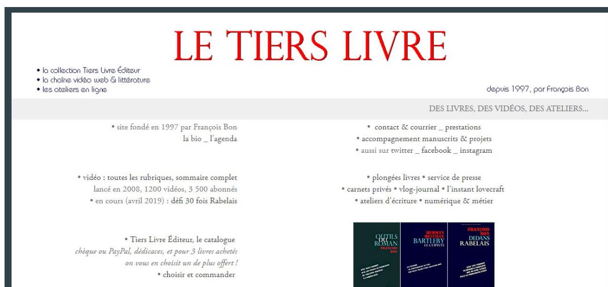
Figure 1. Page d'accueil du Tiers Livre, avril 2019