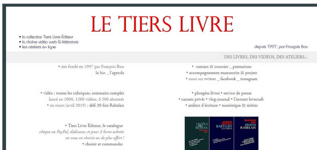
Figure 1. Page d'accueil du Tiers Livre, avril 2019