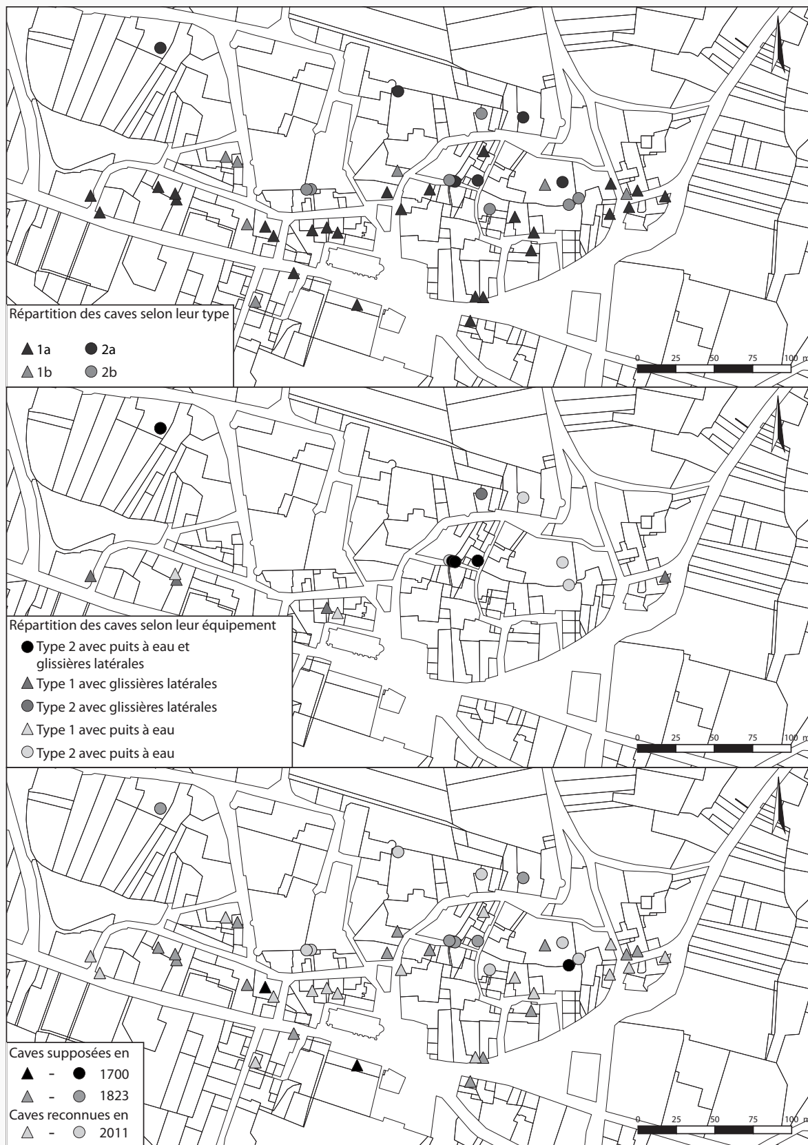
Fig. 1 > Localisation des caves inventoriées dans le village. [État octobre 2017; Jean-Philippe Chimier (dir.)]