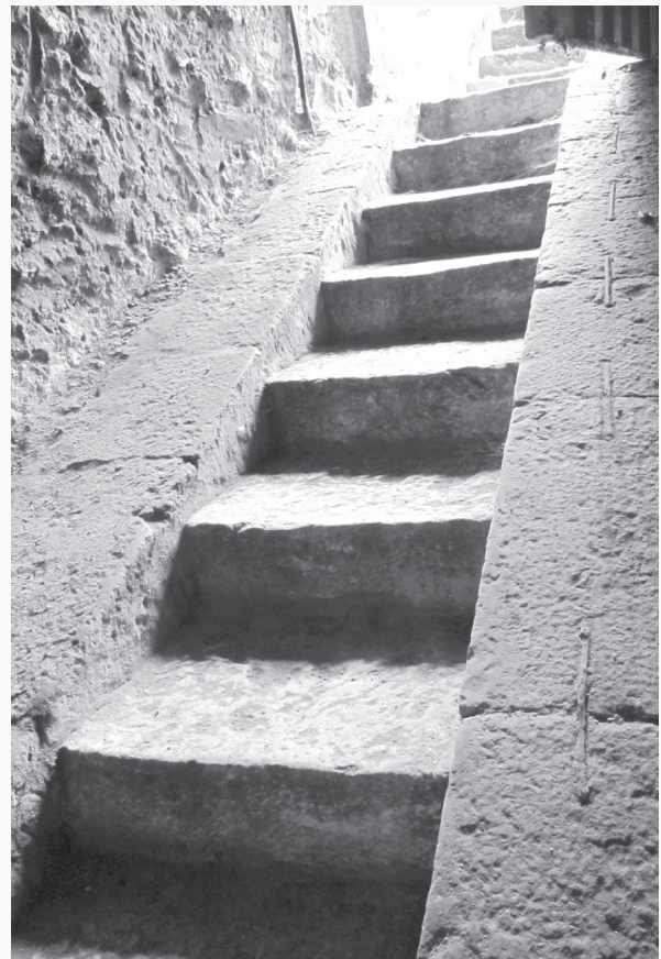
Fig. 3 > L'escalier d'accès à la cave EA_5093, vue depuis l'intérieur.

Une anomalie viaire de tracé ovale d'environ 1,1 ha marque la partie nord-est du village. Le bâti actuel y est de nature variée mais se caractérise par des parcelles aménagées en terrasses et par un système de voies organisé selon des axes nord-sud et est-ouest. L'anomalie présente un dénivelé d'environ 15 m du nord au sud ce qui conduit à reconsidérer l'interprétation initiale d'un enclos, sans pour autant l'exclure (Lorans, 1996, p. 184; Chimier et Fouillet, 2011, p. 8; Joly, Chimier et Fournier, 2014, p. 78-91; Chimier et al., 2016a, p. 61-67). Six caves de type 2 y sont inventoriées et trois dans les parcelles qui la jouxtent au nord. Plusieurs interprétations sont aujourd'hui envisagées au sujet de cette anomalie parcellaire, dont celle d'aménagements d'accès et de circulation liés à des carrières de pierre. Le tracé ovale pourrait avoir été induit par une activité d'extraction de matériaux qui aurait marqué le coteau et créé un réseau viaire à caractère utilitaire.