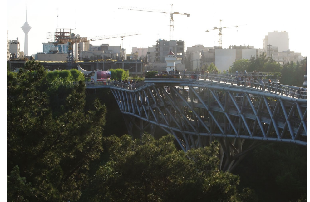
Pont piétonnier Tablath Bridge, Téhéran, Iran, 2016, Agnès et Denis Martouzet.

Cette situation risque de s'aggraver et de s'étendre dans un avenir proche en raison de la crise économique aiguë que la République islamique n'a, jusqu'alors, pas pu maîtriser et de l'absence de dispositifs nécessaires et surtout efficaces pour la prise en charge de toutes les personnes âgées, alors que leur nombre continue de croître rapidement.