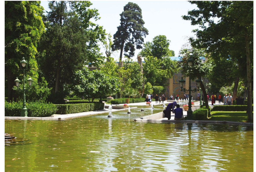
Dans les jardins du palais Golestan, Téhéran, Iran, 2017. Agnès et Denis Martouzet.

dépenses moyennes mensuelles d'un ménage « petite pension » de retraite, et ne permettent en milieu rural étaient de 63 466 rials et en à l'évidence pas aux bénéficiaires de subvenir 2007 de 4 070 504 rials 187 , ces prestations à leurs besoins les plus élémentaires. ressemblent plus à une allocation qu'à une