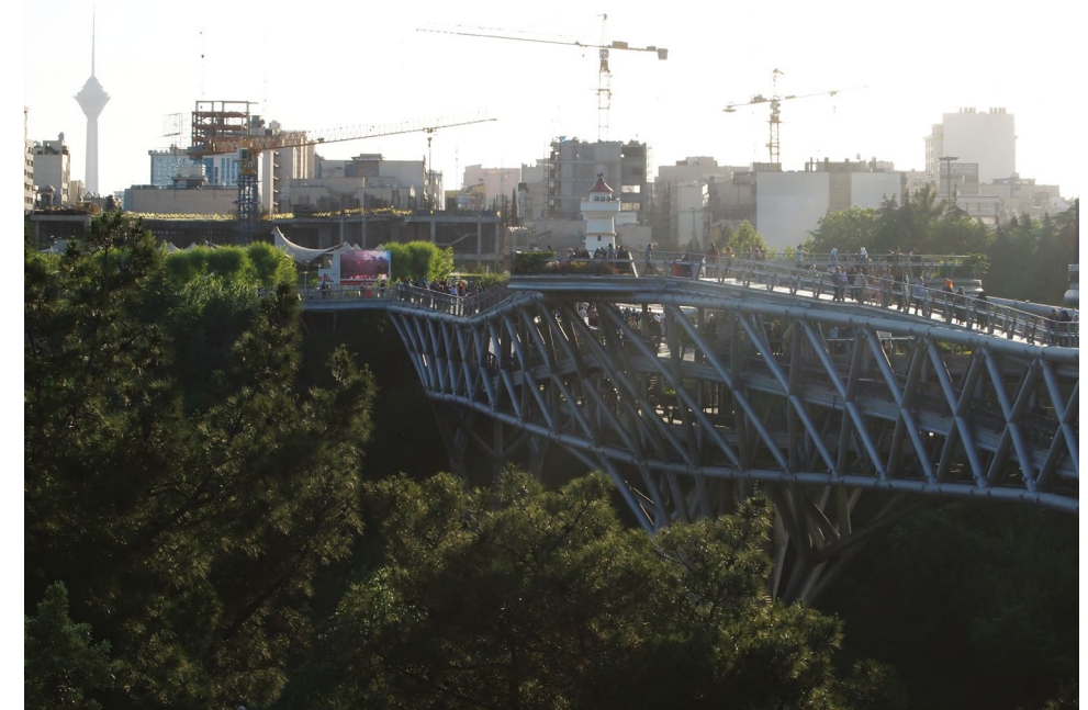
Pont piétonnier Tablath Bridge, Téhéran, Iran, 2016