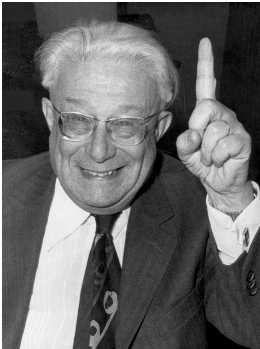
Bielefeld 40 - 1978