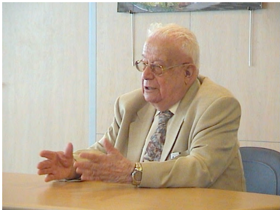
90 ème anniversaire à l'université Paris Diderot en 2004