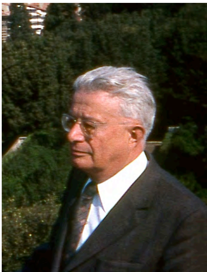
Firenze - 1980

Finalment, qu'il s'agisse de la qualité de l'enseignement ou de la santé des sociétés, la formule clé n'est-elle pas le couple indissociable « LIBERTÉ-RESPONSABILITÉ » ?