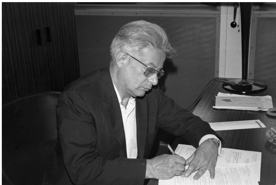
Université Paris 7 – 1972