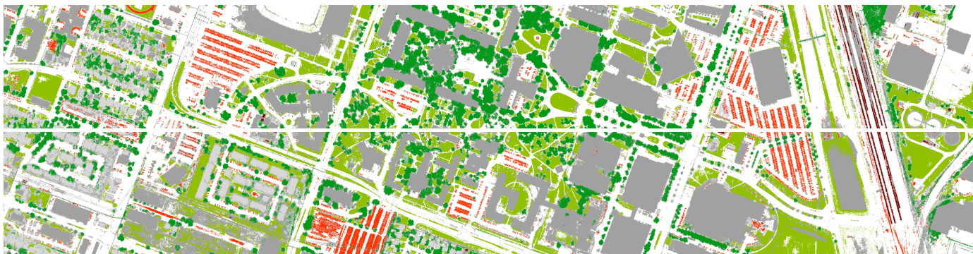
FIGURE 2 – Classification du paysage en utilisant les DSDAP avec les caractéristiques \{N, I, I_r, D, D_r\} .

rastérisées des données LiDAR. Dans cet article, par souci de performance et de simplicité, nous avons choisi de filtrer toutes les caractéristiques LiDAR uniquement en fonction de l’attribut d’aire dont les valeurs ont été établies dans le contexte urbain. Plus précisément, nous considérons trois échelles dominantes :