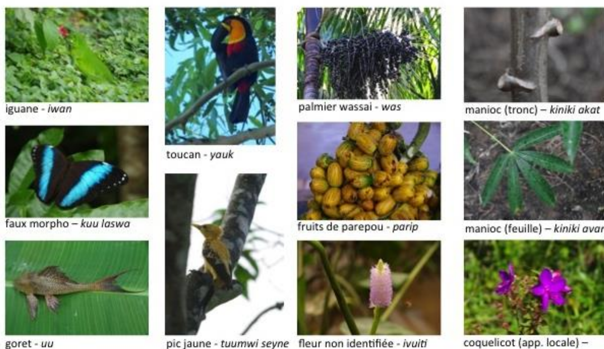
Figure 2 : Exemples de photographies accompagnées des noms d'espèce en français et palikur

d'ordinateur. Les photographies, quasi exclusivement prises en forêt dans la région de Saint George de l'Oyapock, représentent le plus souvent des spécimens de la faune (oiseaux, insectes, reptiles, poissons) et de la flore (arbres, fruits, feuilles) guyanaise, presque tous familiers 20 des informateurs palikur avec lesquels nous avons travaillé. Elles ont été sélectionnées de manière à offrir aux sujets une diversité d'espèces, de formes et bien évidemment de couleurs (voir quelques exemples ci-après).