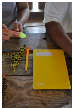
Figure 4 : Exemple d'utilisation d'objets colorés annexes pour vérifier l'étendue de l'usage de wawe et kwikwiye

Ce travail de terrain exploratoire s'est aussi nourri de tout l'environnement dans lequel se déroulaient les séances. Ainsi, comme la photo ci-dessous l'illustre, d'autres objets présents dans l'environnement immédiat ont pu être sollicités afin de clarifier certaines désignations et les frontières catégorielles des couleurs qu'elles expriment.