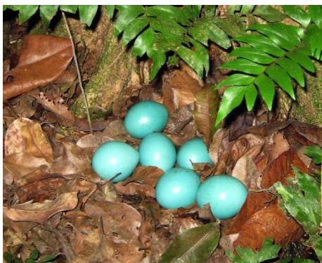
Figure 6 : œufs de perdrix ( inam , Tinamus major )

Dans les deux protocoles, la principale forme utilisée pour désigner le vert, qu'elle soit nue, insérée dans des structures à classificateurs ou accompagnée d'atténuateurs est la forme ayeweye (« vleur »). Wawuye (jaune toucoupi) apparaît dans des contextes renvoyant au vert clair (2 occurrences). L'adjectif igiye (cru, pas mûr) figure dans plusieurs contextes des deux protocoles, et dans le protocole 1, il s'applique de préférence aux végétaux, et surtout aux fruits, ce qui est en cohérence avec le sens premier de l'adjectif. On note également deux formes construites sur ahamna (feuille) : une construction à classificateurs ahamna-pti-ye (feuille-CL:irreg-M/N.DUR) et une construction comparative ayeweye ke ahamna-be (vleur comme feuille-comme). Trois formes métonymiques ont également été relevées : araswayan (œufs de poisson Chaetobranchus flavescens ), accompagné ou non de classificateurs, inamyan (œufs de perdrix, Tinamus major ) sans classificateur (cf. figure 6) et im gasanine (fiel de poisson), également sans classificateur.