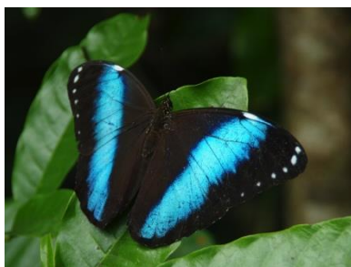
Figure 7 : Laswa - faux morpho

La forme laswa est utilisée par un informateur pour désigner le bleu clair (presque métallique) en lien avec les deux papillons qui sont la référence de cette couleur, le morpho et le faux morpho ( cf. photo ci-dessous). L'information n'a pas pu être confirmée par d'autres informateurs.