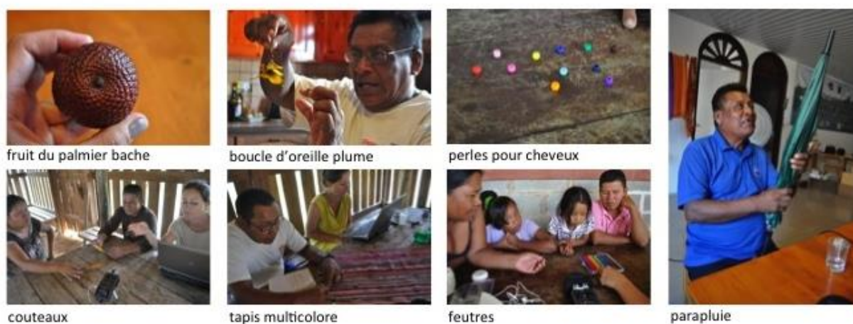
Figure 3 : Exemples d'objets présentés aux informateurs

Les photographies présentées ci-après illustrent quelques-uns des objets présentés en situation.