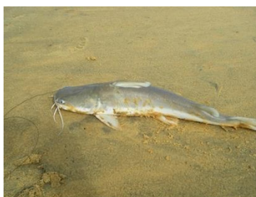
Figure 5. Mâchoiran blanc