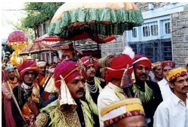
Membres de la famille royale lors de la procession du premier jour du Daśahrā, octobre 2001.