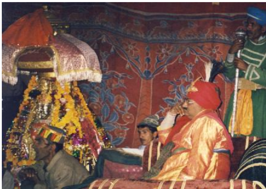
Le raja attend l'arrivée des palanquins des divinités de village au cours du darbār (assemblée) organisé lors de la fête. certains palanquins sont déjà là et ont obtenu l'honneur de « s'asseoir » à côté du roi. Octobre 2001.