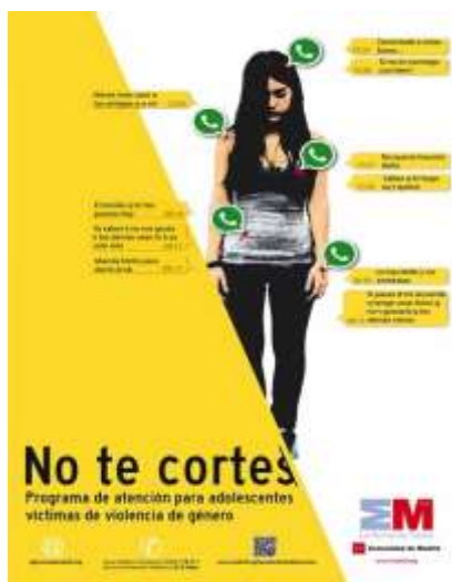
Figura 1. Campaña de la Comunidad de Madrid contra el machismo en adolescentes diseñada para el curso 2014-2015.

Así, si analizamos las últimas campañas publicitarias para prevenir la violencia y el machismo entre adolescentes (ver Figura 1) y en personas adultas (ver Figura 2) realizadas por la Comunidad de Madrid, se puede constatar que emplean estas Perspectivas Críticas Conservadoras reproduciendo imágenes y modelos de lo que precisamente quieren erradicar con dichas campañas.