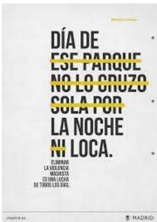
Figura 3. Campaña del Ayuntamiento de Madrid contra el machismo en adolescentes diseñada para el curso 2016-2017.

Así, si analizamos las últimas campañas publicitarias para prevenir la violencia y el machismo entre adolescentes (ver Figura 3) realizadas por el Ayuntamiento de Madrid, se puede constatar que emplean estas Perspectivas Críticas Radicales reproduciendo imágenes y modelos que se presentan como alternativas posibles, orgullosas, libres y descaradas de lo que quieren erradicar.