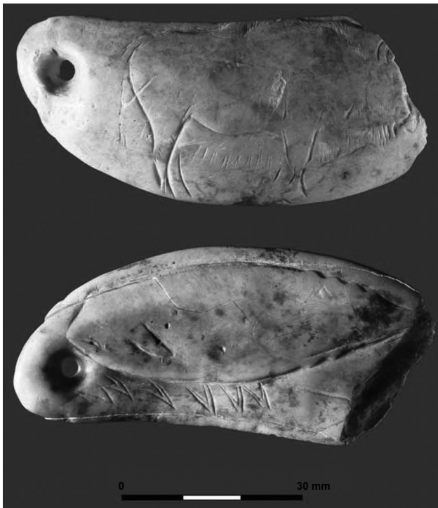
Fig. 2. Las Caldas à Oviedo (Asturies, Espagne), Magdalénien moyen. Dent de cachalot percée et gravée d'un bison et d'un cétacé (cachalot ou bélouga ?).

sites magdaléniens du Sud-Ouest français et de la côte cantabrique au nord de l'Espagne, dans la principauté des Asturies: une gravure sur paroi à Tito Bustillo à Ribadesella, une sur dent de cachalot à Las Caldas à Oviedo (fig. 2), une sur spatule en os de mammifère terrestre au Bourrouilla d'Arancou (Pyrénées-Atlantiques), une sur baguette en bois de cervidé à La Vache d'Alliat (Ariège), et une sur bâton percé en bois de renne à Montgaudier à Montbrond (Charente); suivant les cas et les auteurs, des identifications comme cachalot, bélouga, baleine franche ou baleine grise ont été suggérées pour les animaux figurés. Mais c'est finalement lors de ces dix dernières années que l'essentiel des vestiges se rapportant aux cétacés du Paléolithique récent en Europe a été repéré et publié.