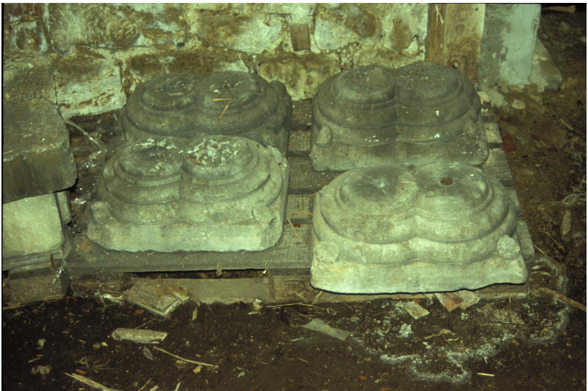
Fig. 14 : Quelques-unes des bases doubles.