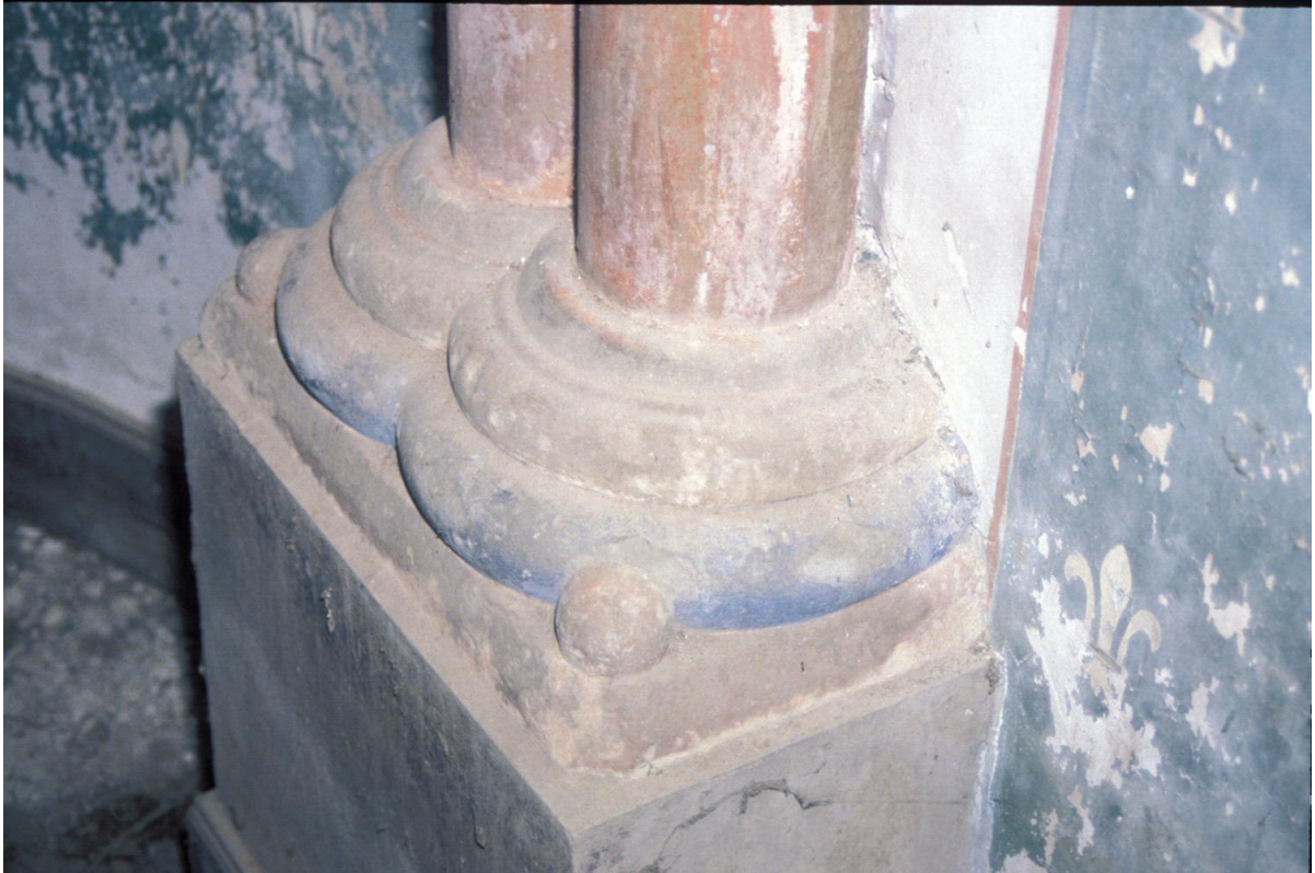
Fig. 19 : Berdoues, ancienne chapelle, la base du support 2S.