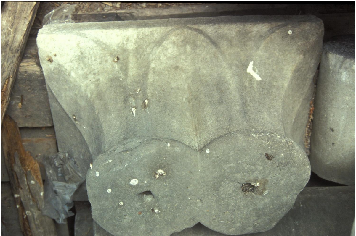
Fig. 34 : Le chapiteau n° 9.