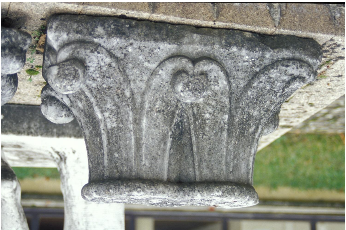
Fig. 42 : Mirande, musée des Beaux-Arts, un des chapiteaux romans.