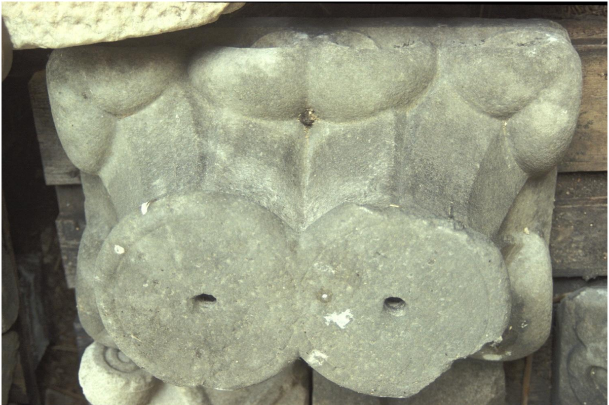
Fig. 27 : Le chapiteau n° 4.