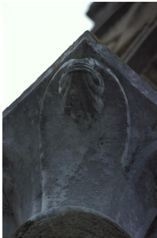
Fig. 48 : Sauviac, détail d'un des deux chapiteaux remployés provenant de Berdoues.