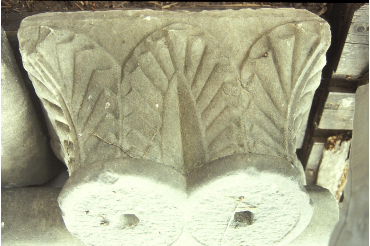
Fig. 31 : Le chapiteau n° 6.