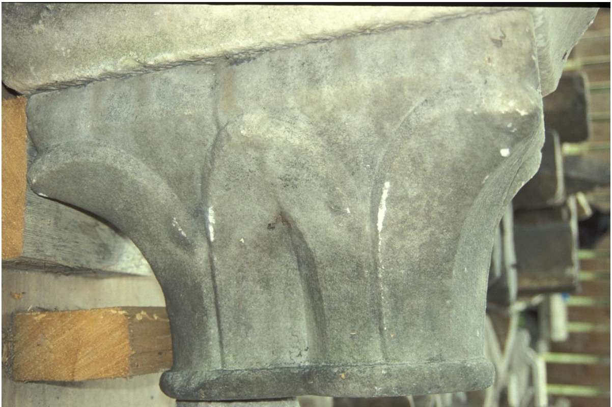
Fig. 32 : Le chapiteau n° 7.