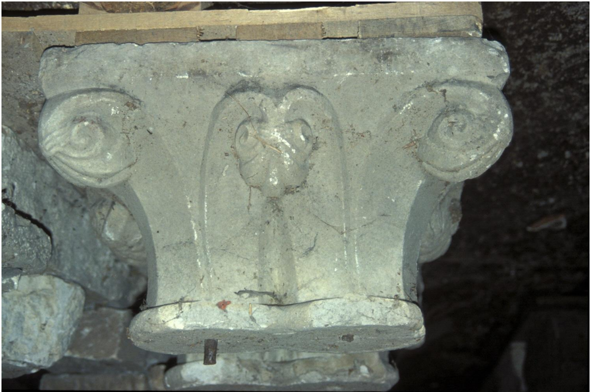
Fig. 45 : Le chapiteau n° 14.