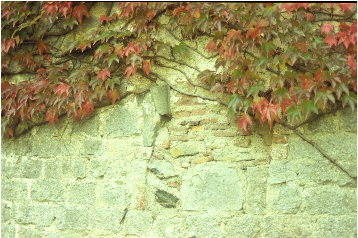
Fig. 10 : L'Escaladieu, ancienne abbaye cistercienne, mur sud du cloître, vestiges du voûtement.