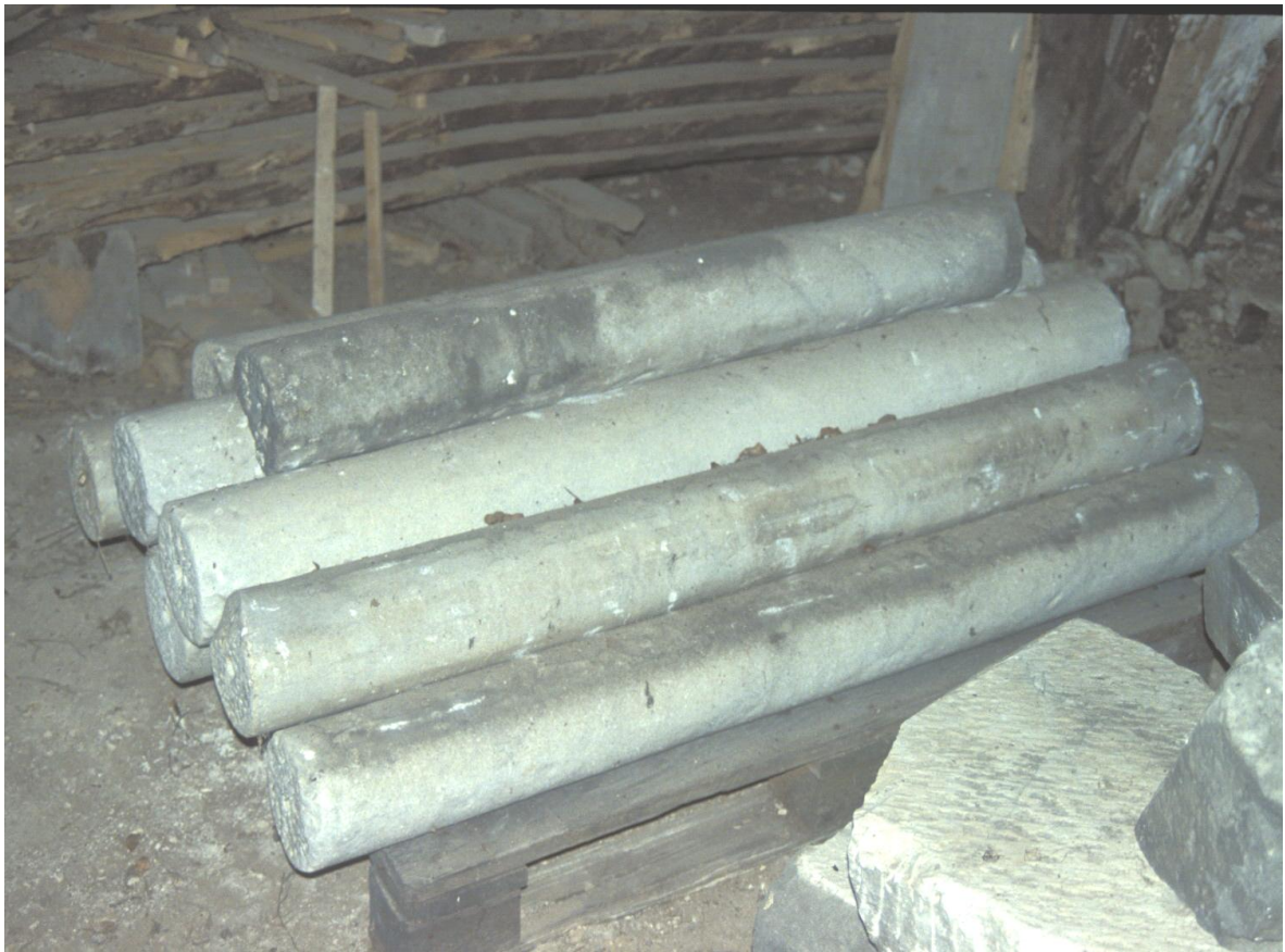
Fig. 5 : Quelques-unes des colonnes entières.