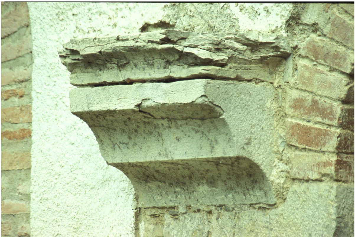
Fig. 8 : L'Escaladieu, ancienne abbaye cistercienne, une console du cloître.