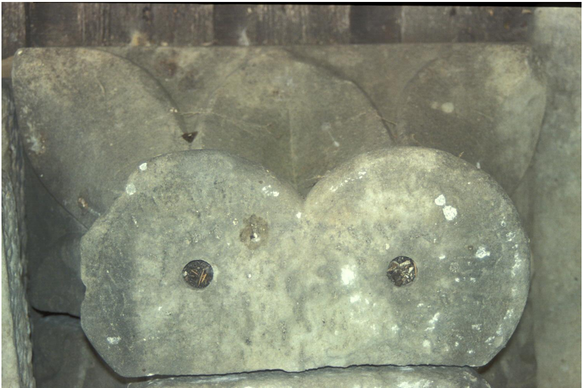
Fig. 36 : Le chapiteau n° 11.