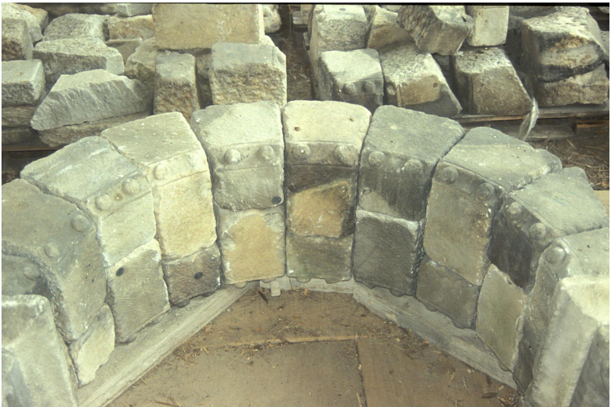
Fig. 4 : Détail de l'arcade remontée.