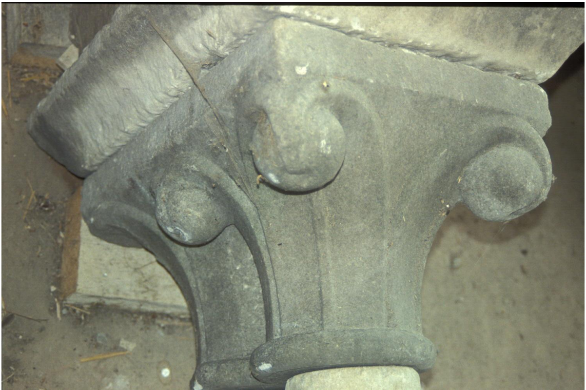
Fig. 40 : Le chapiteau n° 12.