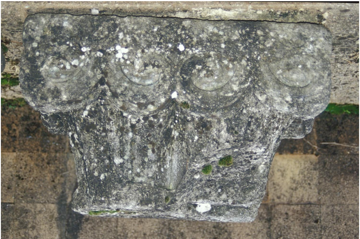
Fig. 30 : Mirande, musée des Beaux-Arts, un des chapiteaux romans.