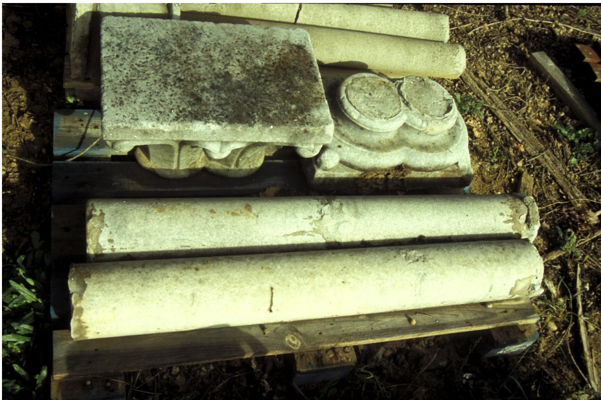
Fig. 6 : Marciac, vestiges d'une arcature démontée, vue d'ensemble.