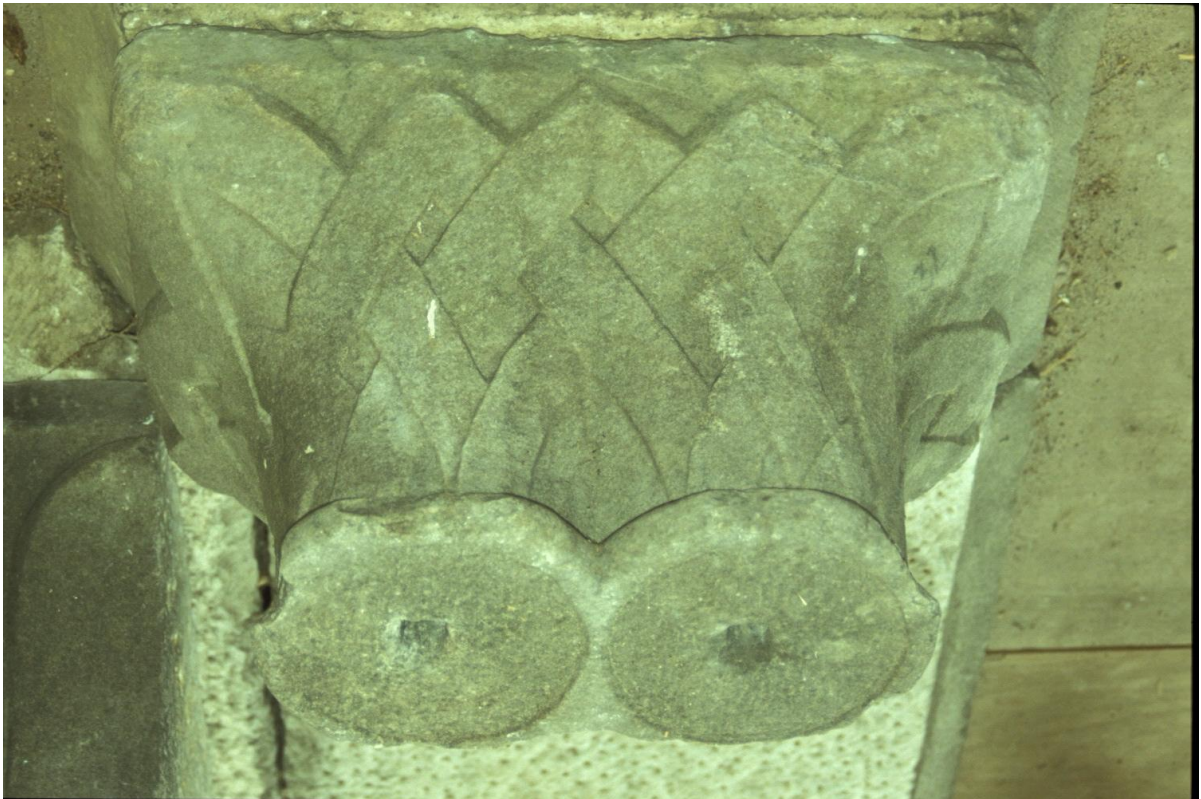
Fig. 25 : Le chapiteau n° 2.