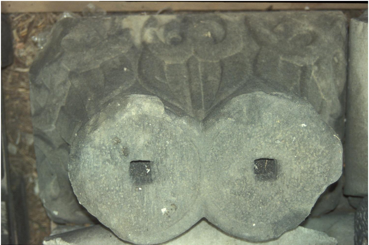
Fig. 49 : Le chapiteau n° 16.