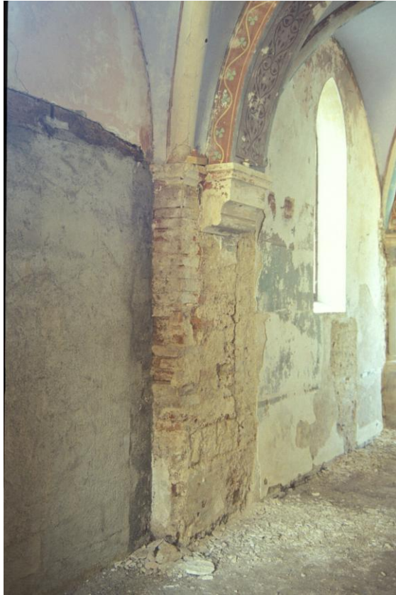
Fig. 11 : Berdoues, ancienne chapelle, détail de l'élevation intérieure.