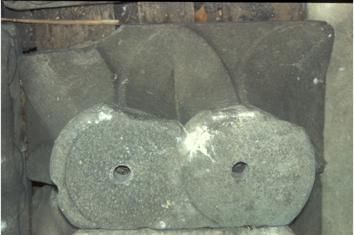
Fig. 35 : Le chapiteau n° 10.