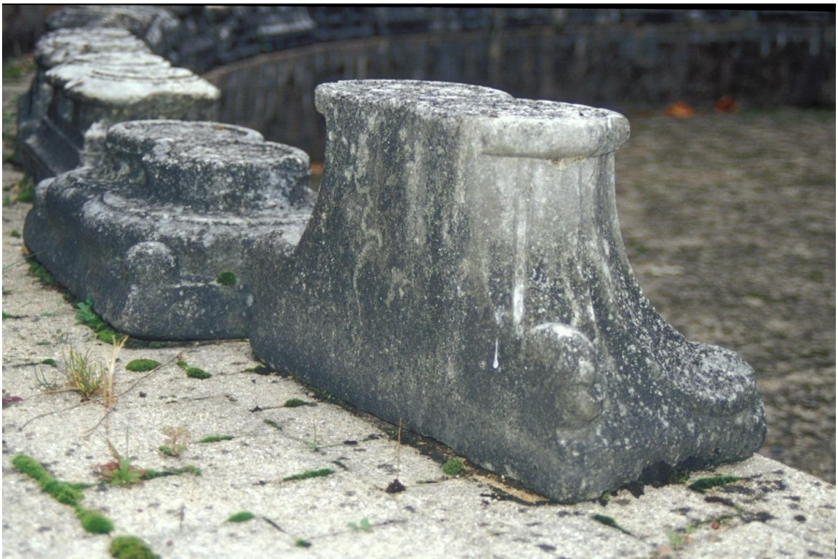
Fig. 22 : Mirande, musée des Beaux-Arts, un des chapiteaux pour colonnes doubles adossées.