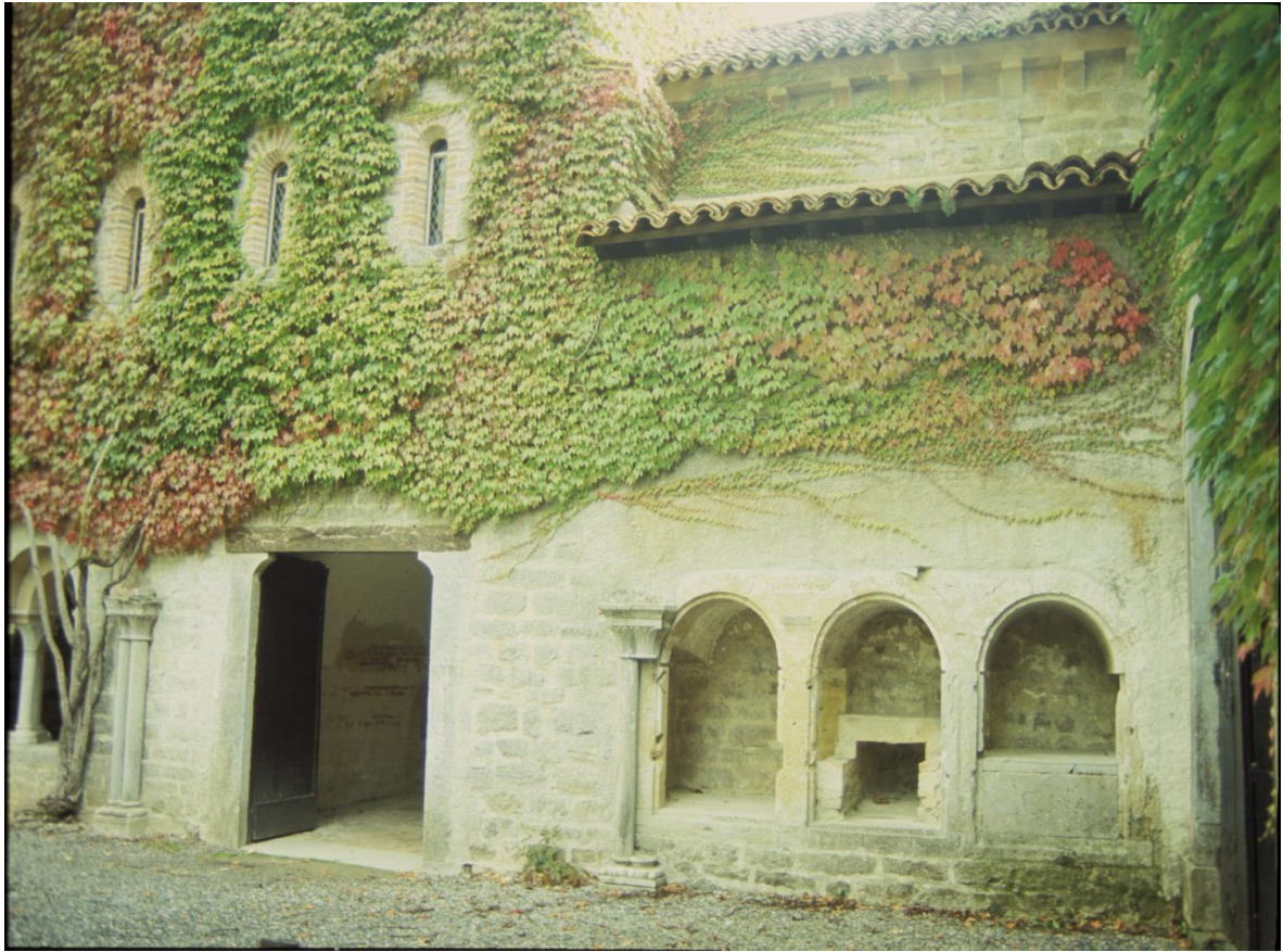
Fig. 7 : L'Escaladieu, ancienne abbaye cistercienne, une partie de l'aire du cloître.