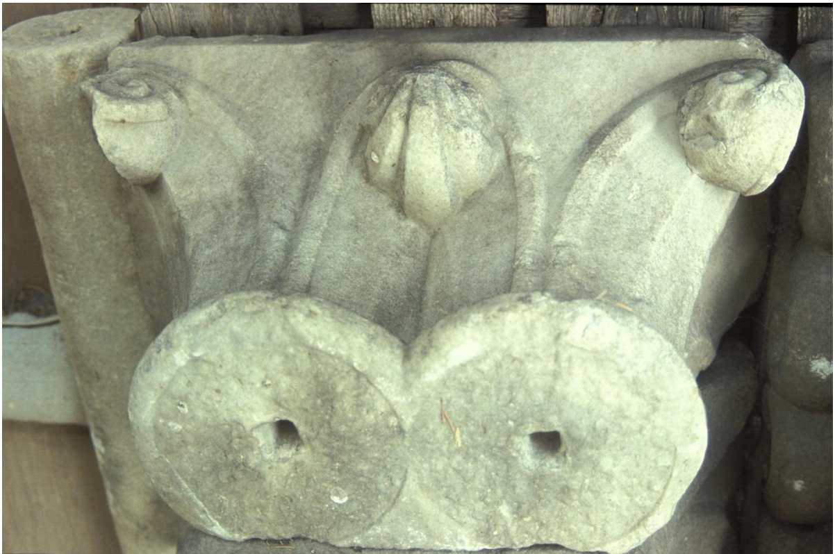
Fig. 44 : Le chapiteau n° 13.