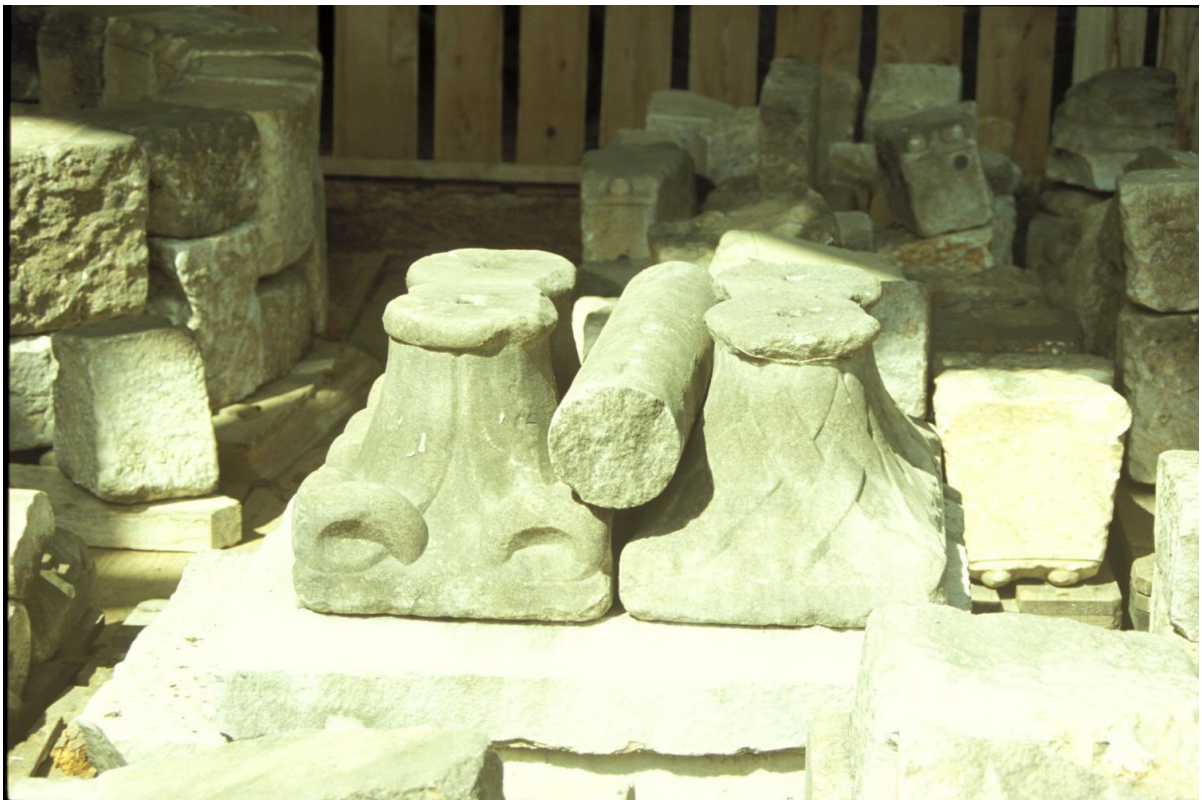
Fig. 20 : Deux des chapiteaux revenus d'Allemagne.