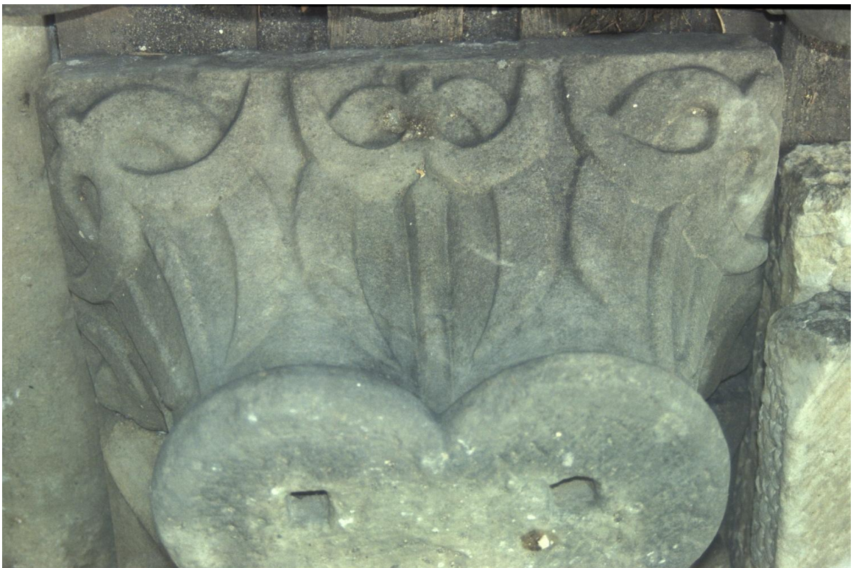
Fig. 50 : Le chapiteau n° 17.