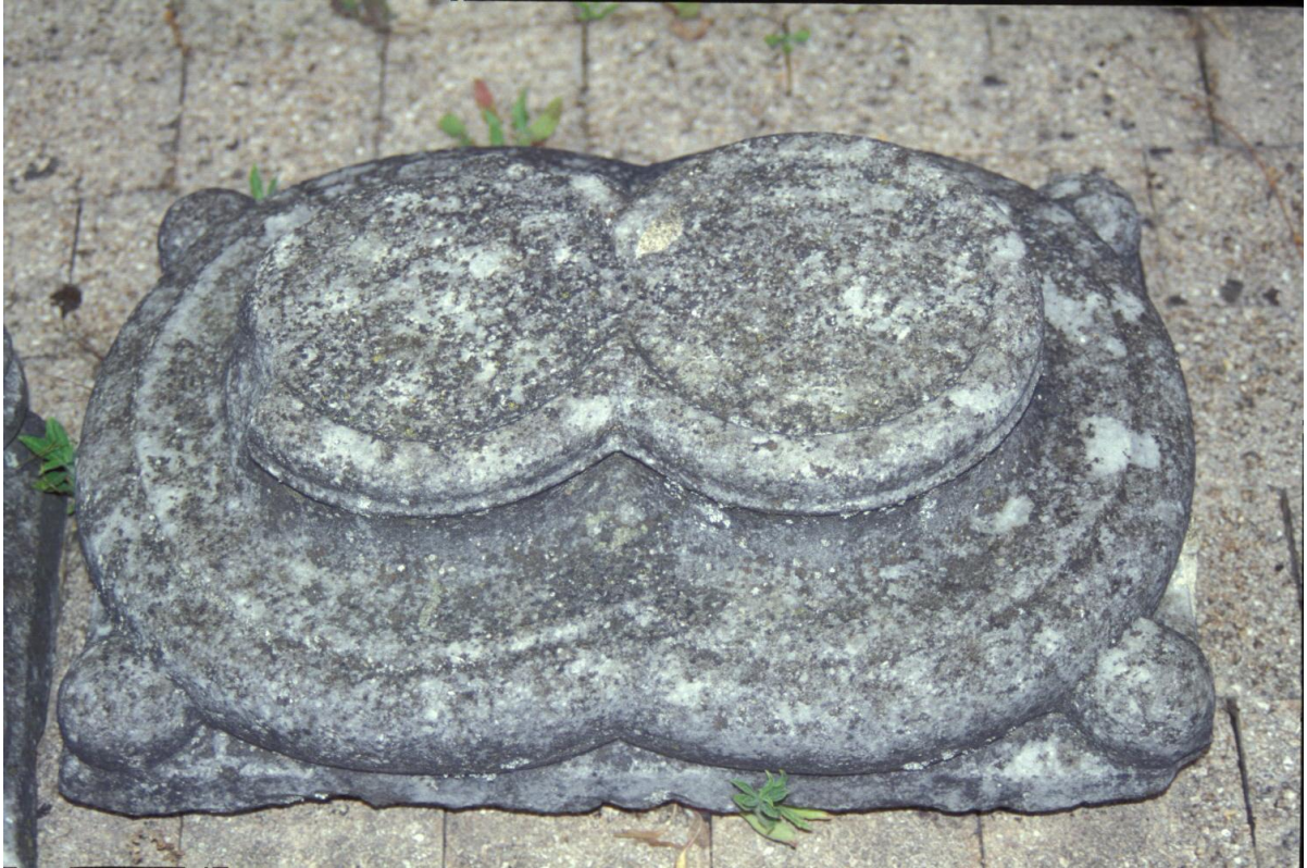
Fig. 17 : Mirande, musée des Beaux-Arts, la base double.