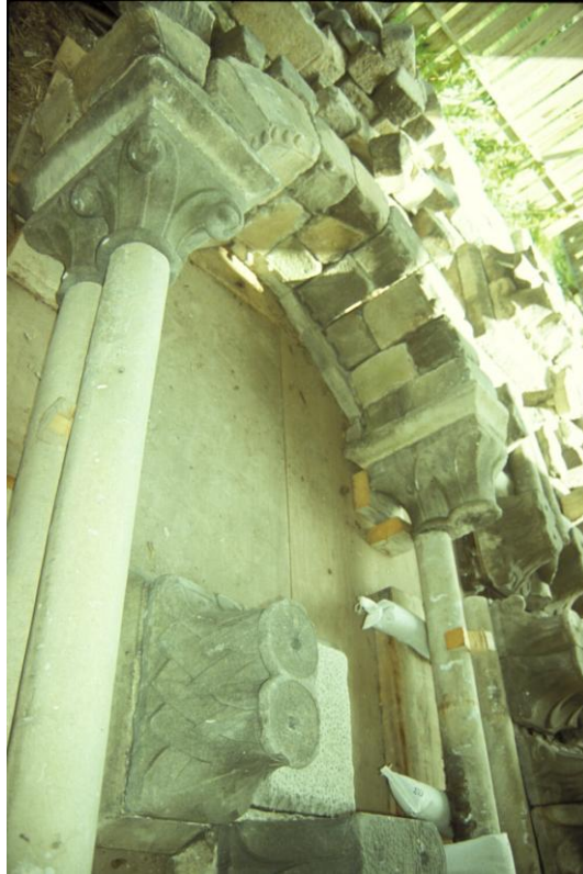
Fig. 3 : L'arcade remontée avec des éléments du fonds lapidaire.