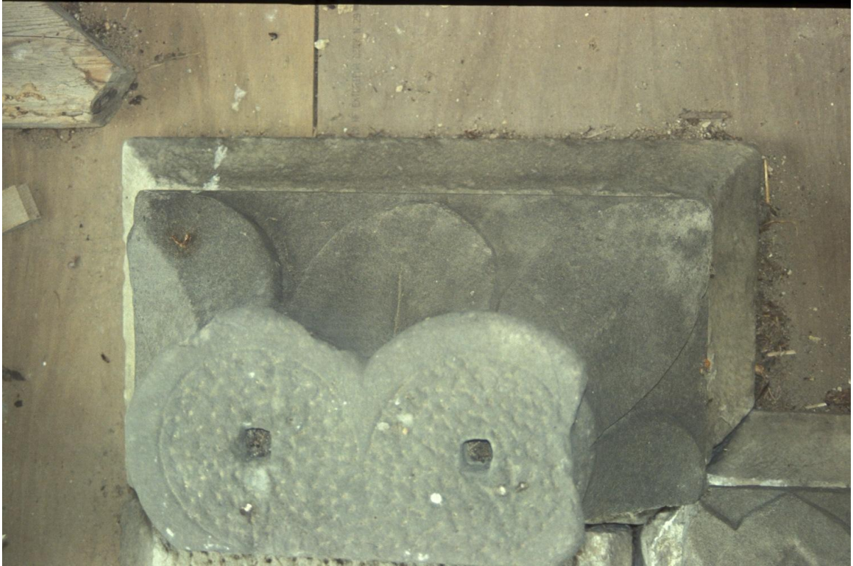
Fig. 33 : Le chapiteau n° 8.