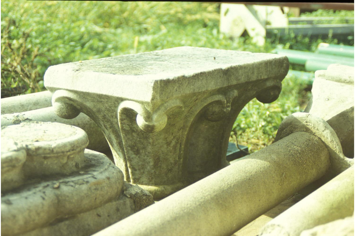
Fig. 43 : Marciac, vestiges d'une arcature démontée, le chapiteau double.