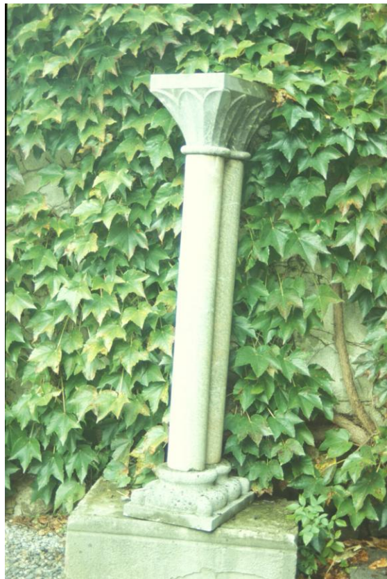
Fig. 12 : L'Escaladieu, ancienne abbaye cistercienne, vestiges des supports du mur-bahut ?