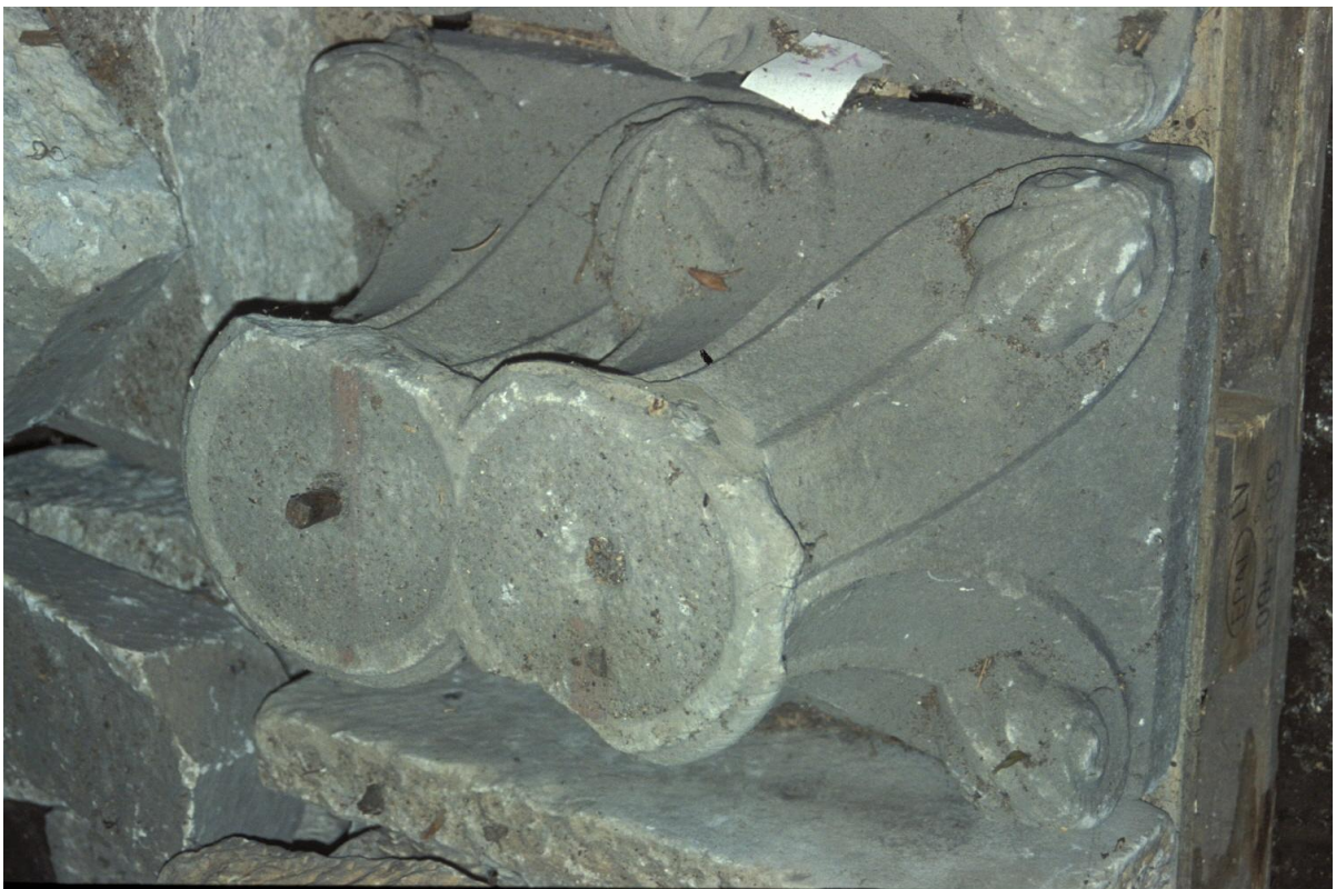
Fig. 46 : Le chapiteau n° 15.