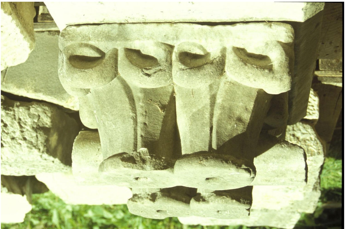
Fig. 28 : Le chapiteau n° 5.