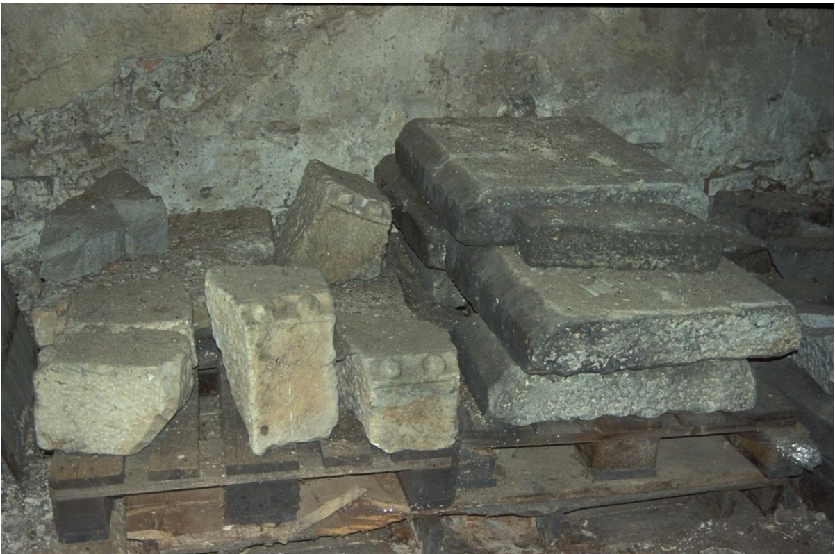
Fig. 2 : Quelques-uns des voussoirs à boules.