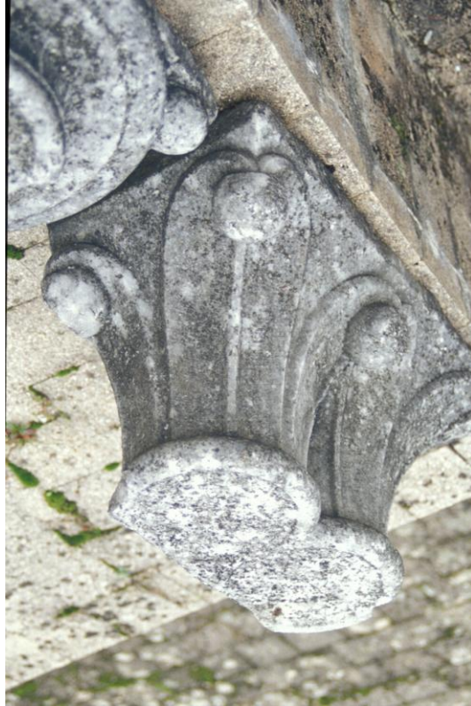
Fig. 21 : Mirande, musée des Beaux-Arts, un des chapiteaux romans.