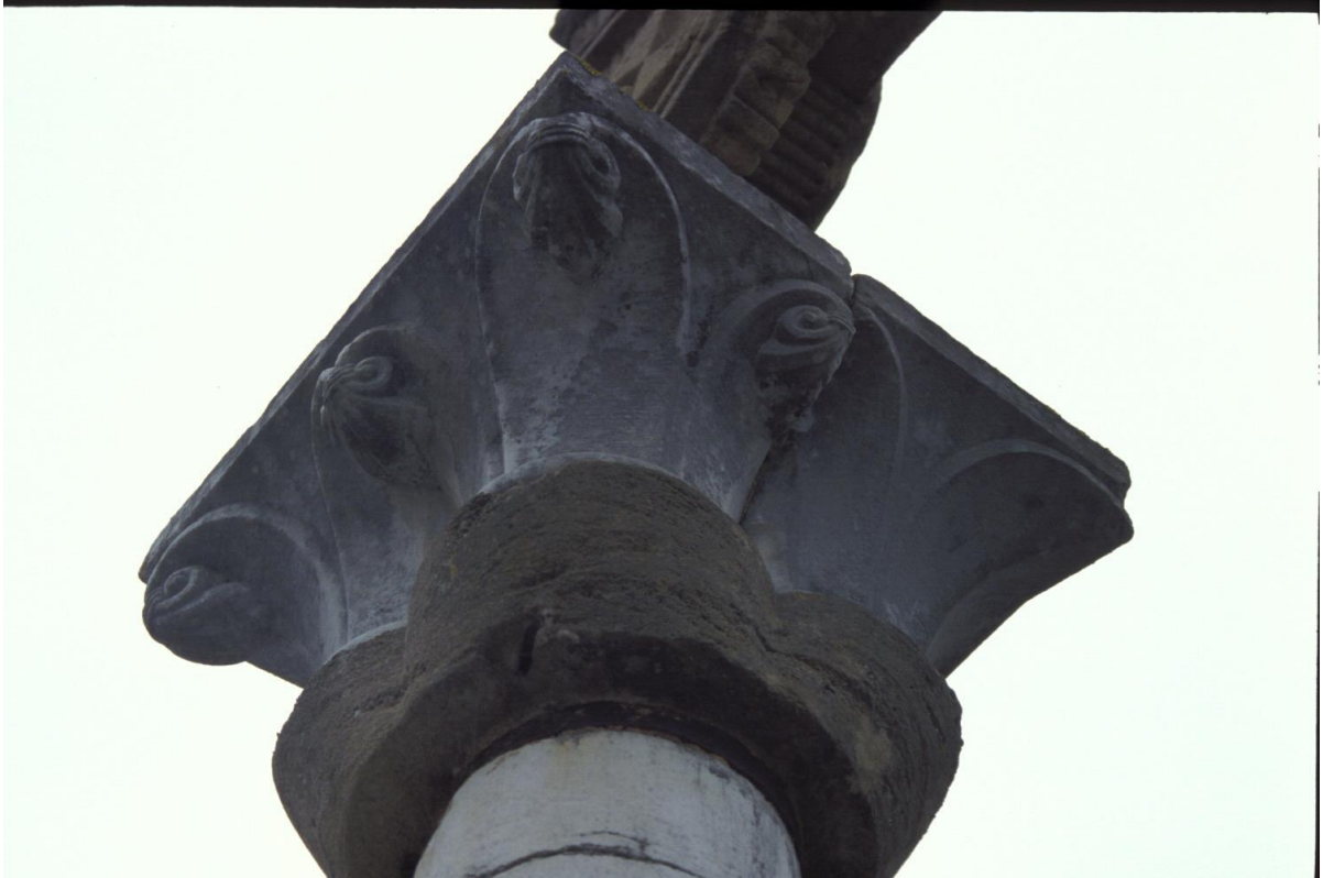
Fig. 39 : Sauviac, deux chapiteaux remployés provenant de Berdoues.