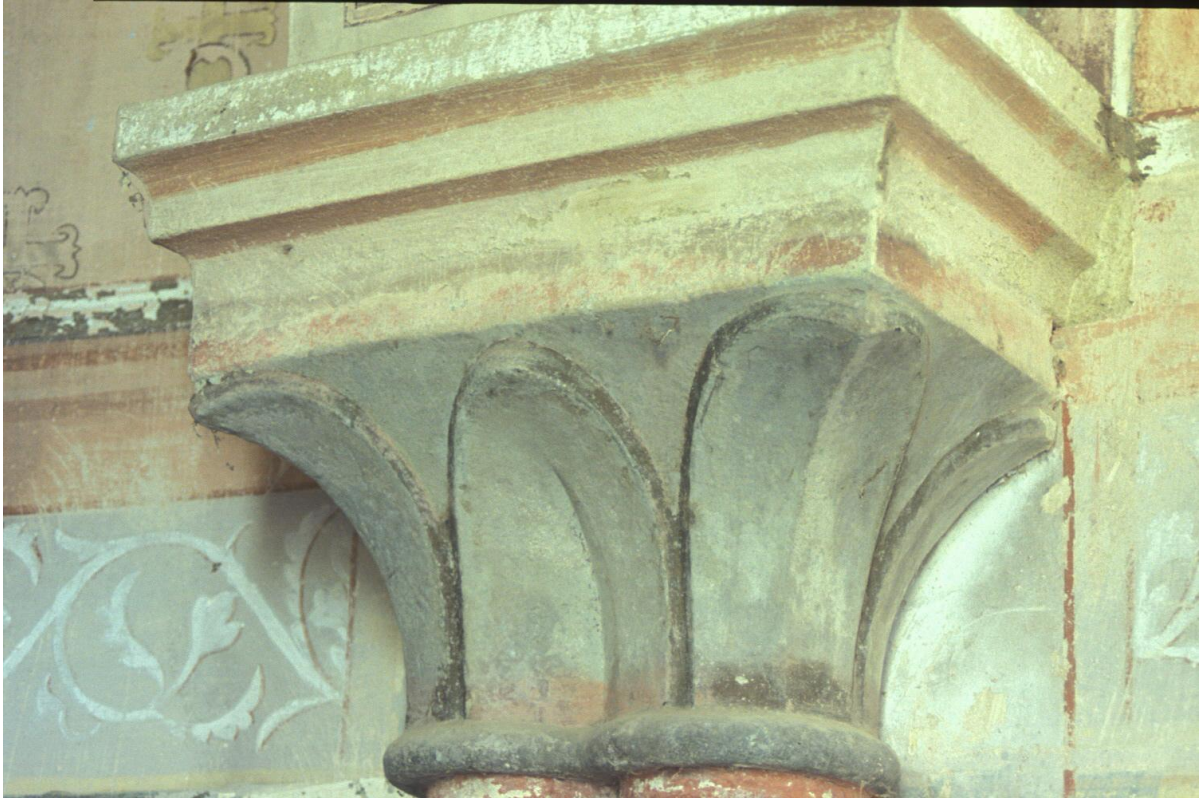
Fig. 37 : Berdoues, ancienne chapelle, le chapiteau du support 2S.