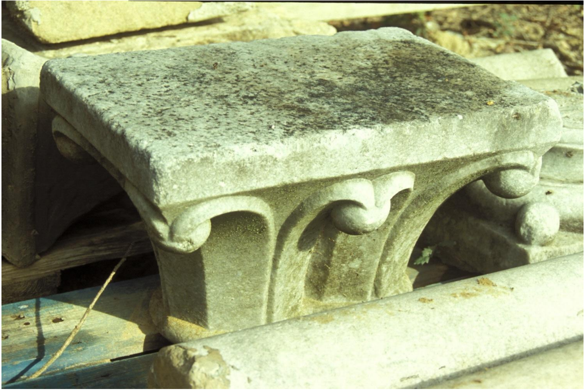
Fig. 23 : Marciac, vestiges d'une arcature démontée, le chapiteau double.