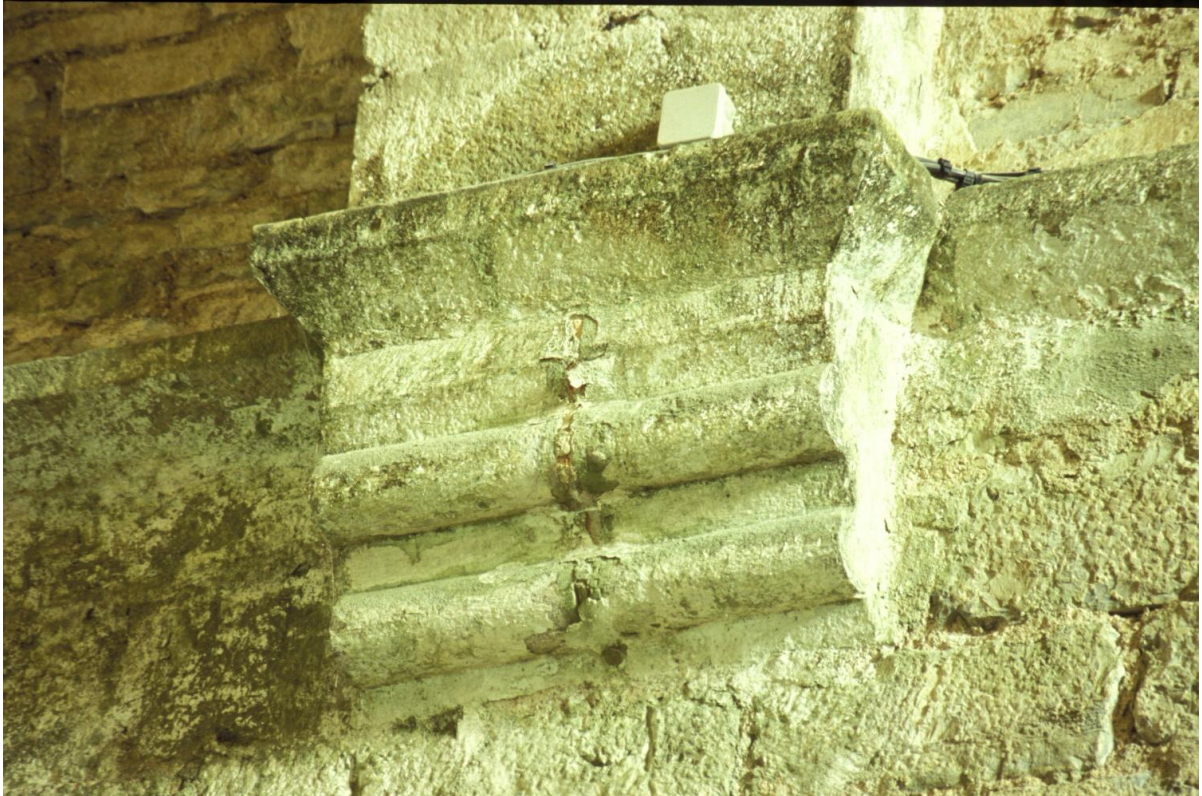
Fig. 13 : L'Escaladieu, ancienne abbaye cistercienne, une console du vaisseau central de l'abbatiale.