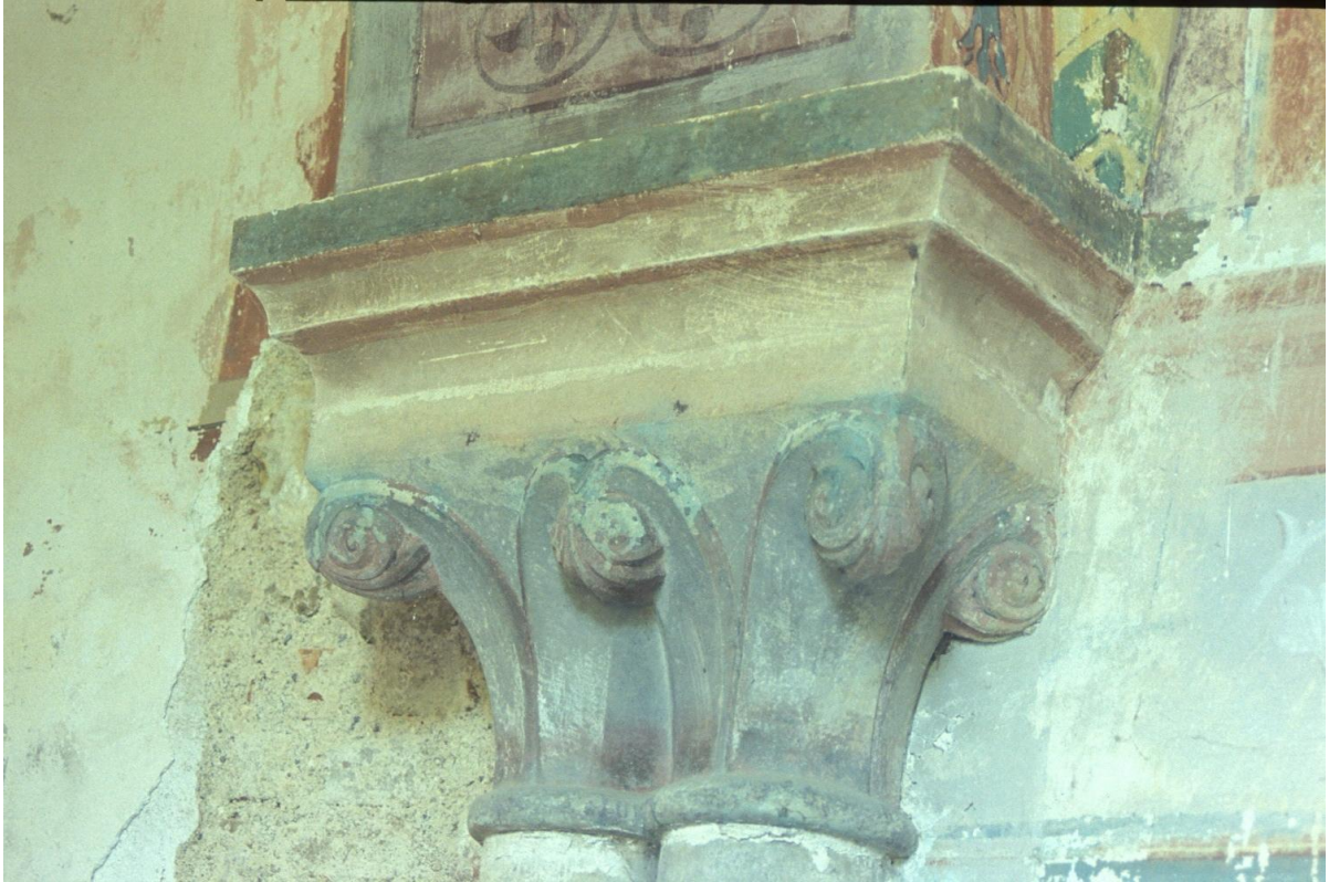
Fig. 47 : Berdoues, ancienne chapelle, le chapiteau du support 1N.