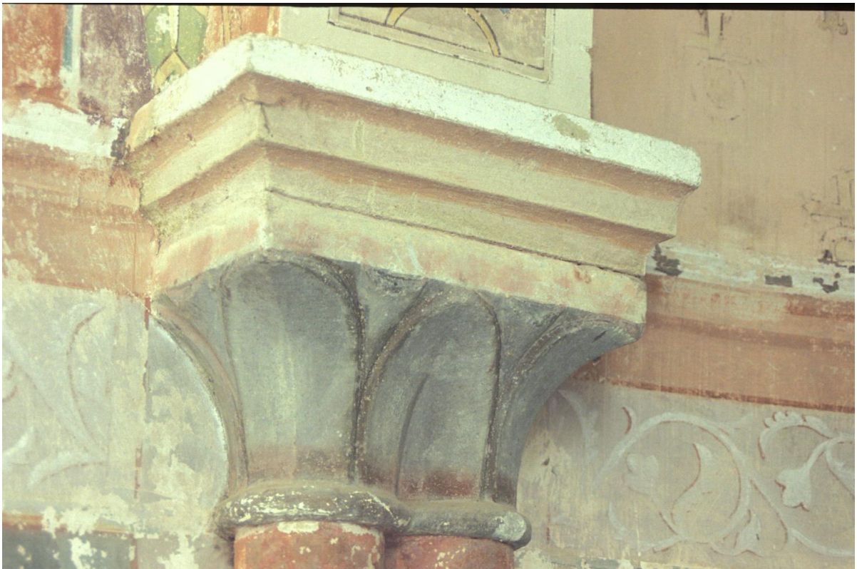
Fig. 38 : Berdoues, ancienne chapelle, le chapiteau du support 2N.