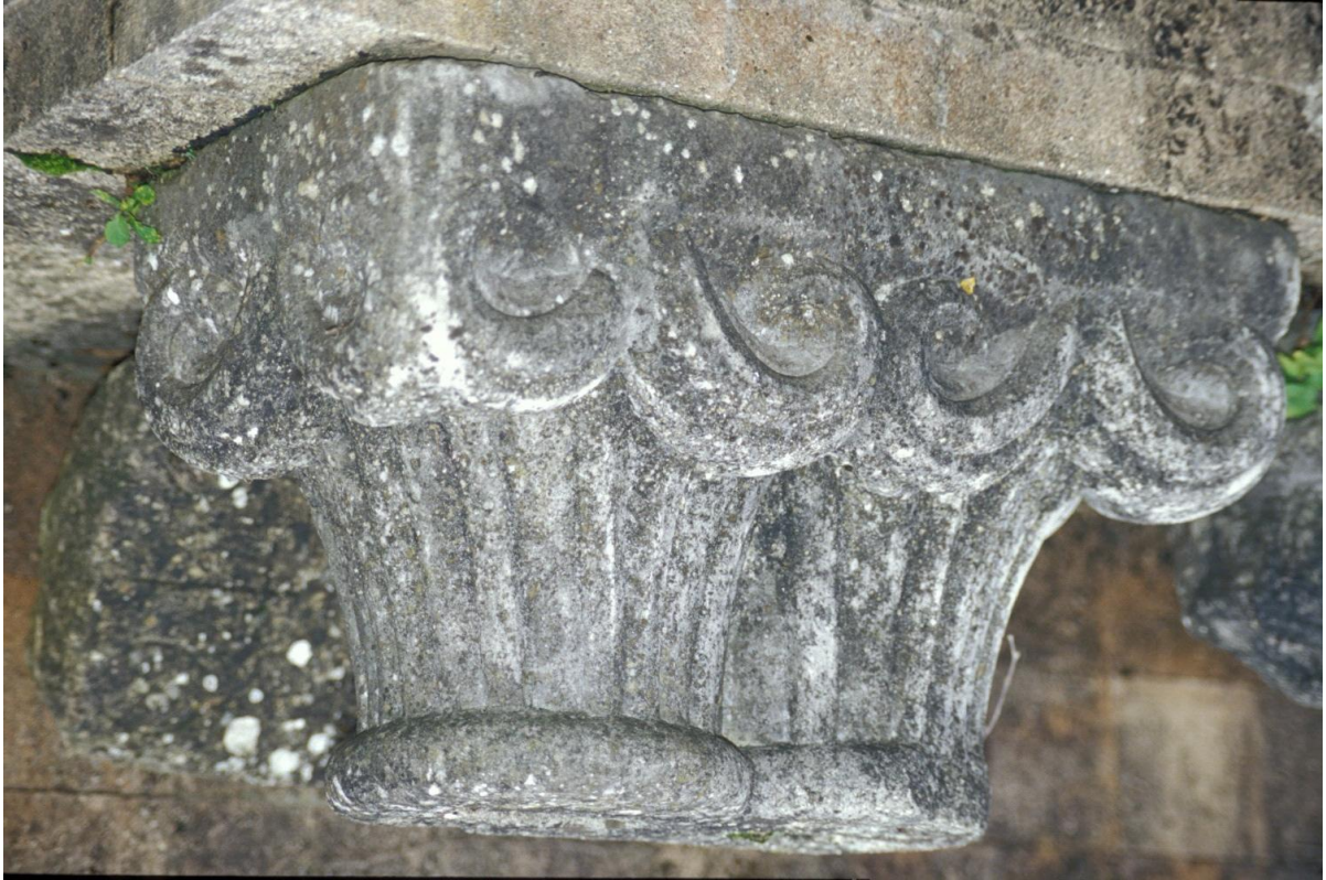
Fig. 29 : Mirande, musée des Beaux-Arts, un des chapiteaux romans.