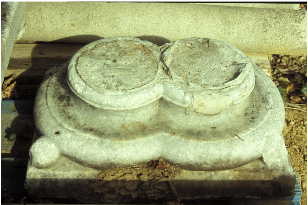
Fig. 16 : Marciac, vestiges d'une arcature démontée, la base double.