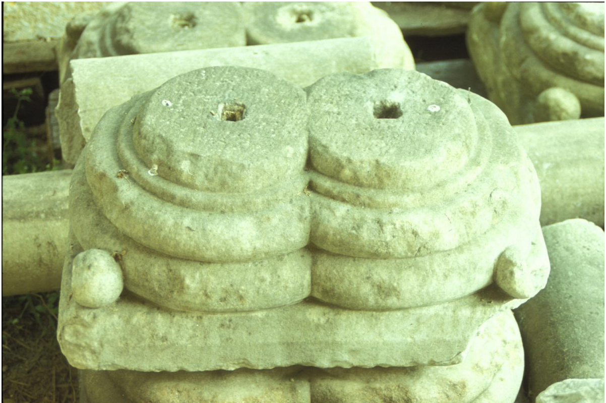
Fig. 15 : Une base double pour colonnes libres.