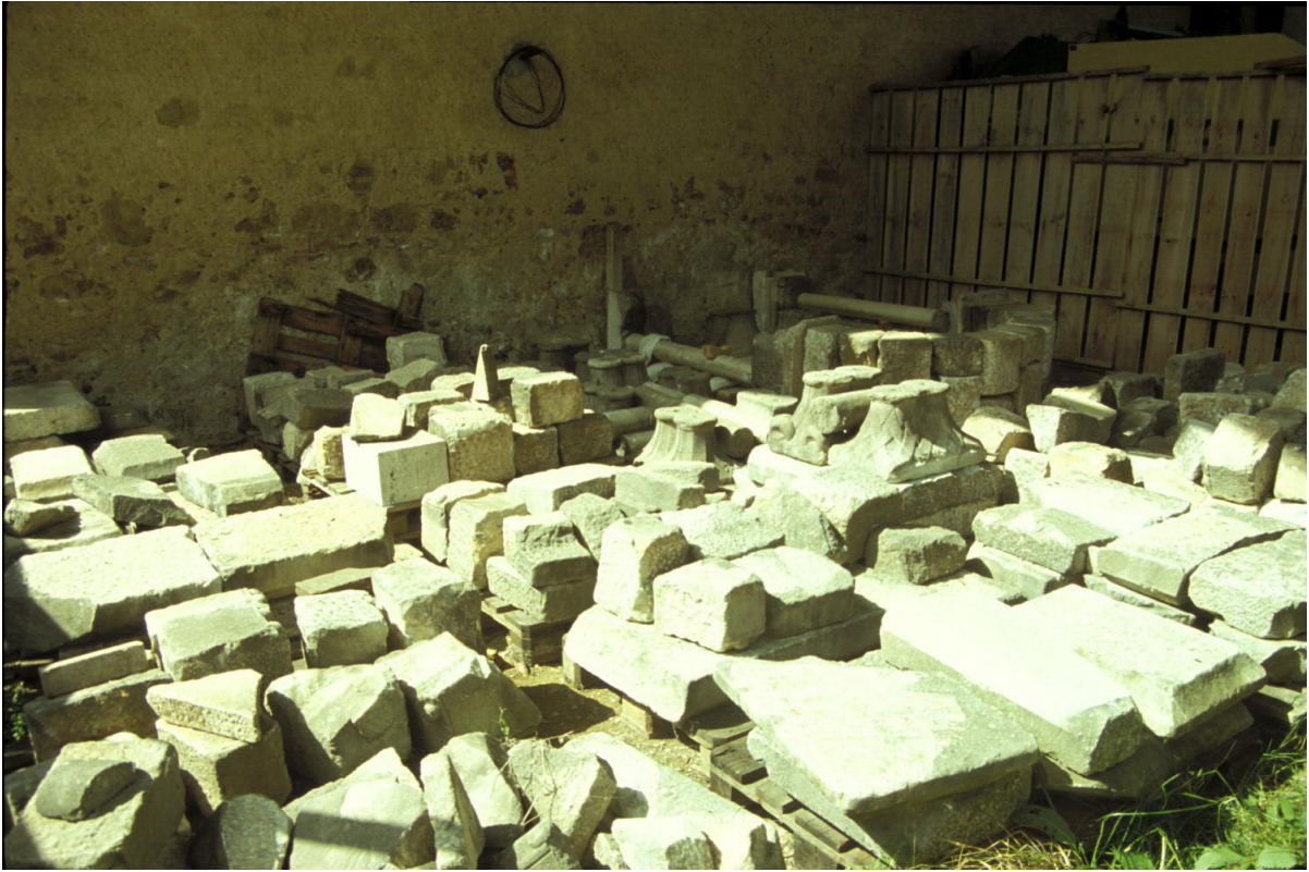
Fig. 1 : Vue d'ensemble d'une partie du dépôt lapidaire.