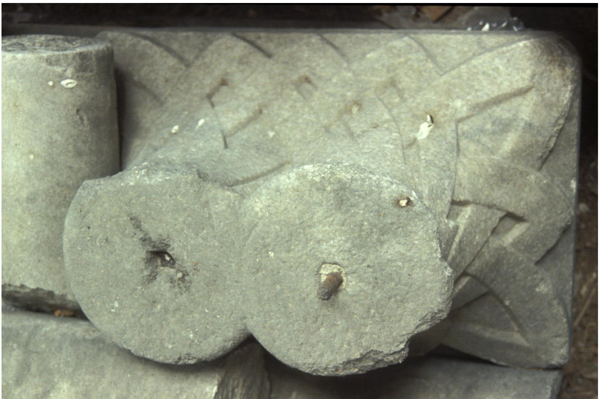
Fig. 26 : Le chapiteau n° 3.