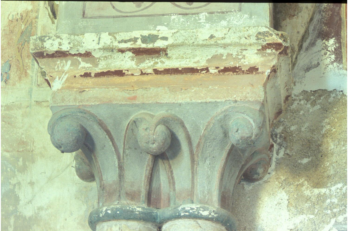
Fig. 41 : Berdoues, ancienne chapelle, le chapiteau du support 1S.