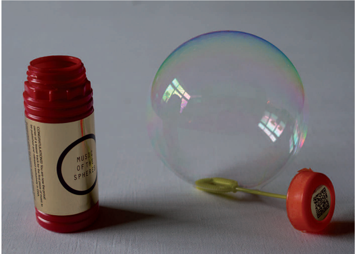
MUSIQUE DES SPHÈRES de Charlotte Jarvis en collaboration avec Nick Goldman. Composition originale de Mira Calix encodée dans de l'ADN mélangé ensuite à du savon (2014).