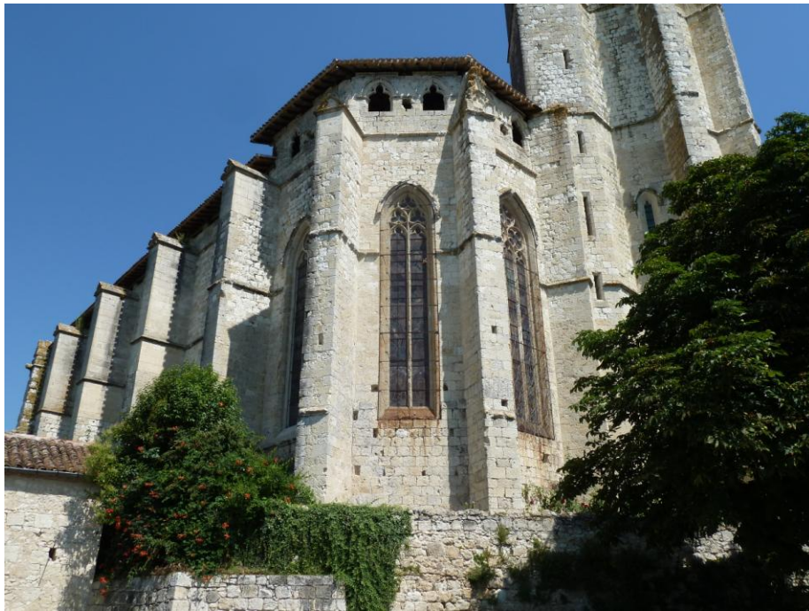
Fig. 1 : Ancienne collégiale de La Romieu. Le chevet.