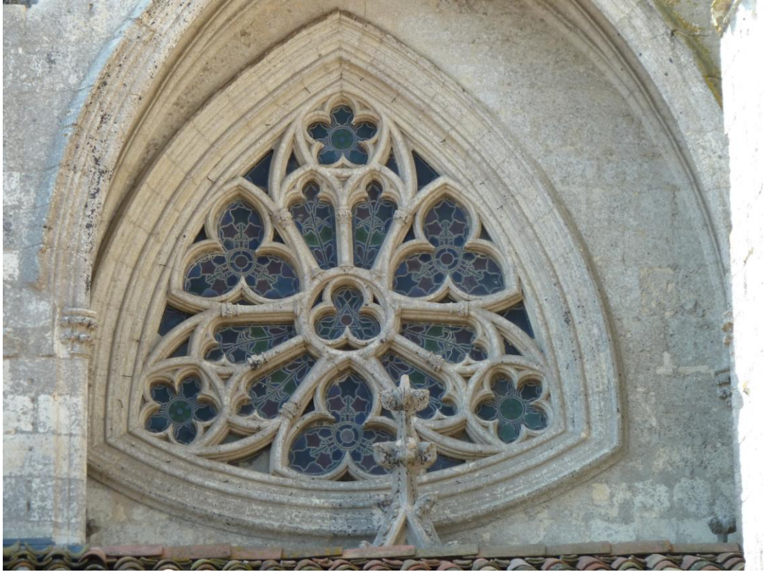
Fig. 4 : Ancienne collégiale de La Romieu. La rose septentrionale.