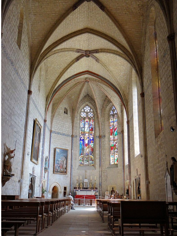
Fig. 2 : Ancienne collégiale de La Romieu. Détail de l'élévation des supports de la nef.