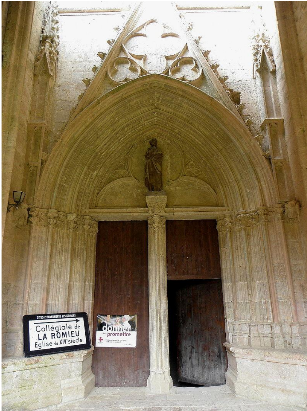
Fig. 5 : Ancienne collégiale de La Romieu. Le portail septentrional.