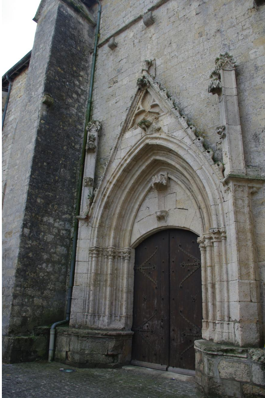
Fig. 6 : Eglise paroissiale de Montréal. Le second portail septentrional.