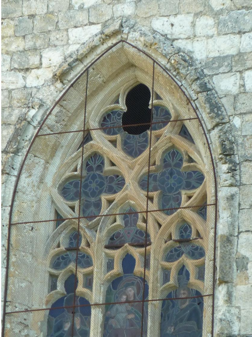
Fig. 3 : Ancienne collégiale de La Romieu. Détail d'une baie.