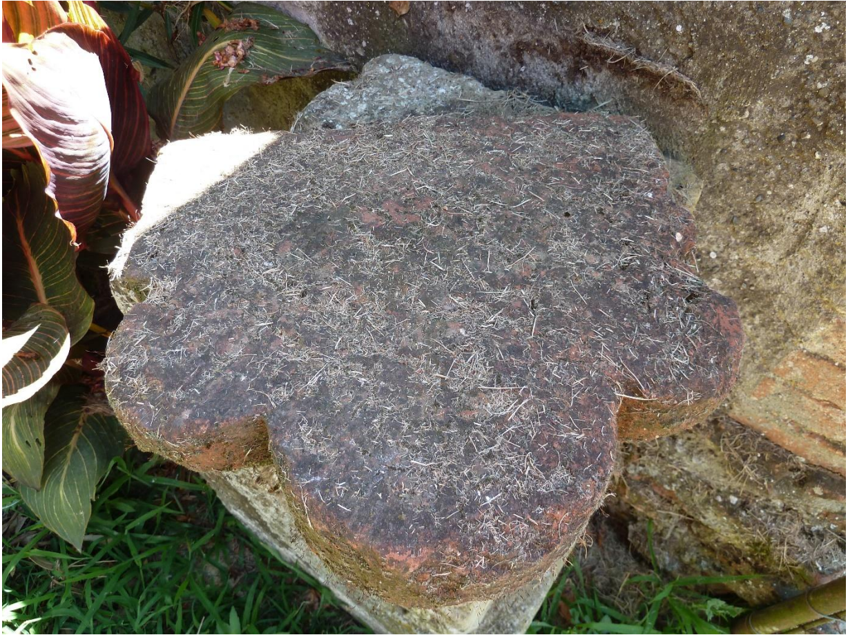
Fig. 8 : Vestiges de l'abbaye de Fabas, un voussoir de brique adapté à la clef 3.