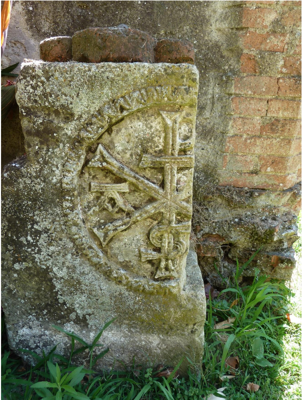
Fig. 3 : Vestiges de l'abbaye de Fabas, partie gauche d'un chrisme.