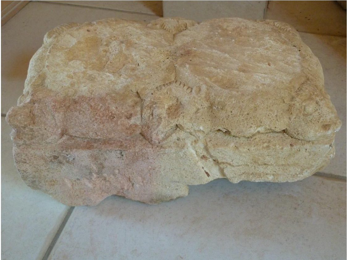
Fig. 12 : Vestiges de l'abbaye de Goujon, une base double.