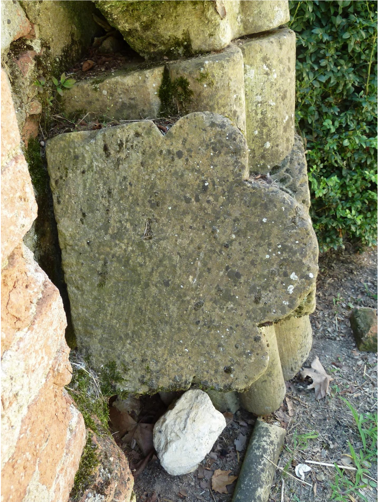
Fig. 7 : Vestiges de l'abbaye de Fabas, clef de voûte 3, détail.