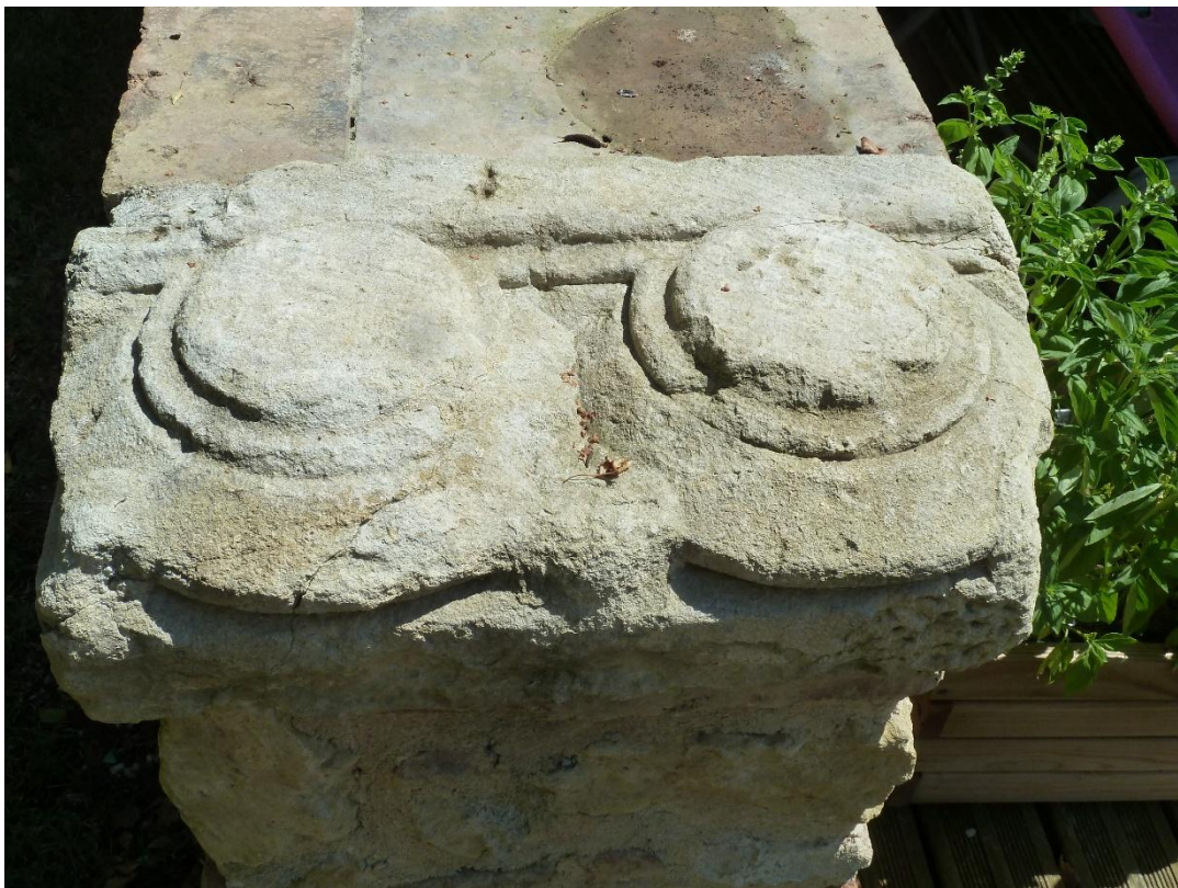
Fig. 2 : Vestiges de l'abbaye de Fabas, base pour colonnes jumelles.