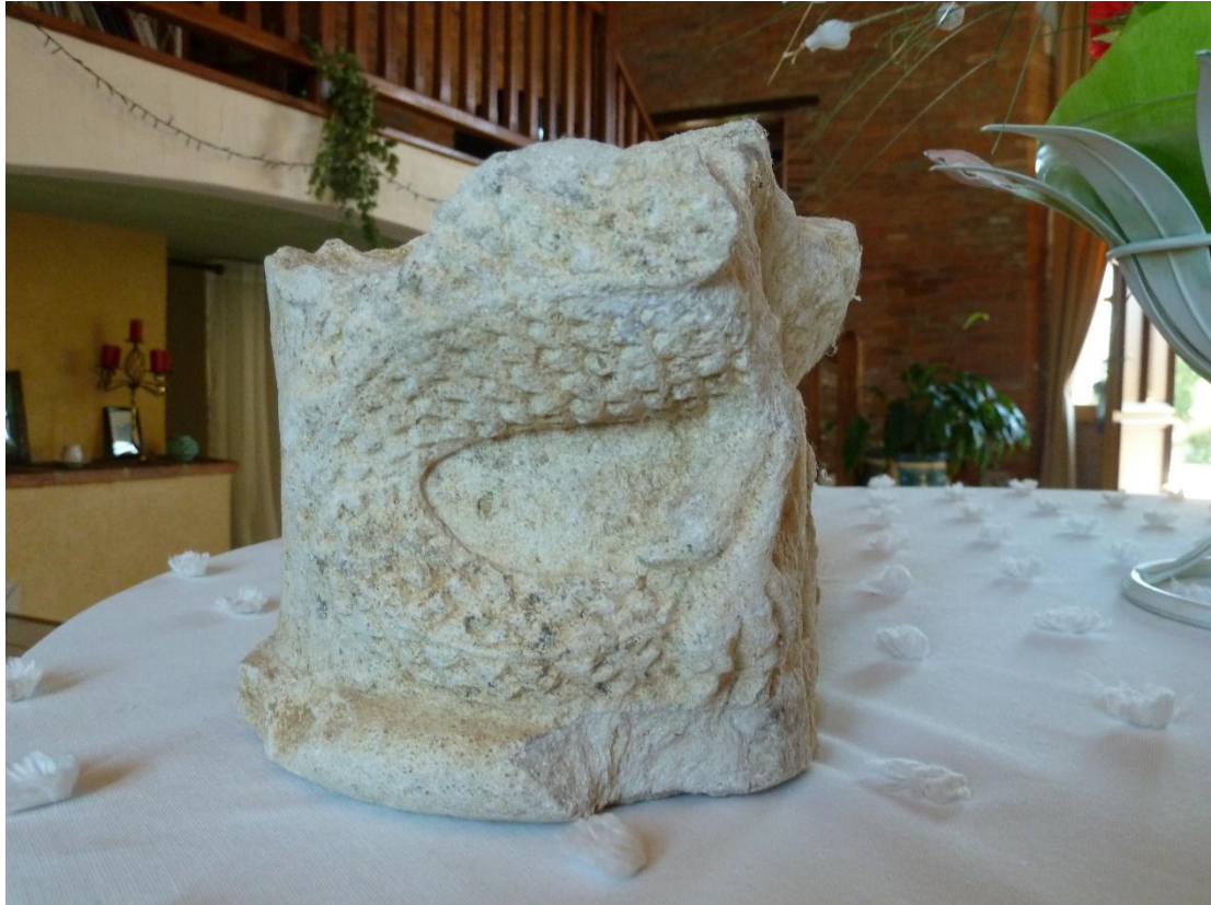
Fig. 14 : Vestiges de l'abbaye de Goujon, le chapiteau.