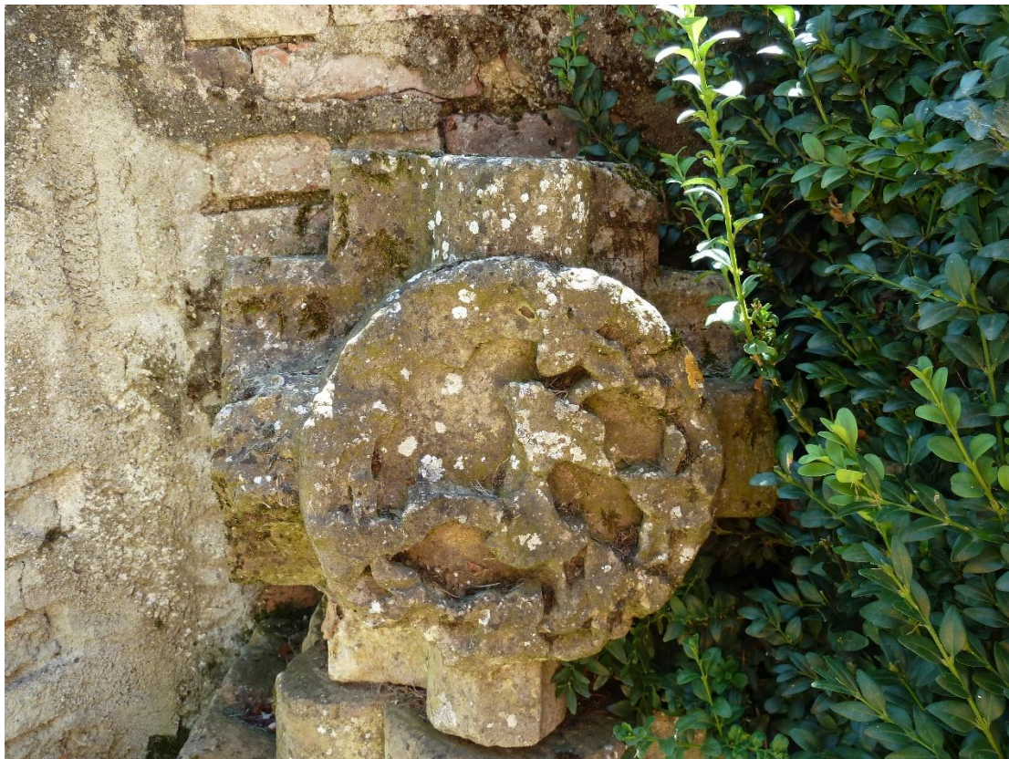
Fig. 5 : Vestiges de l'abbaye de Fabas, clef de voûte 2.