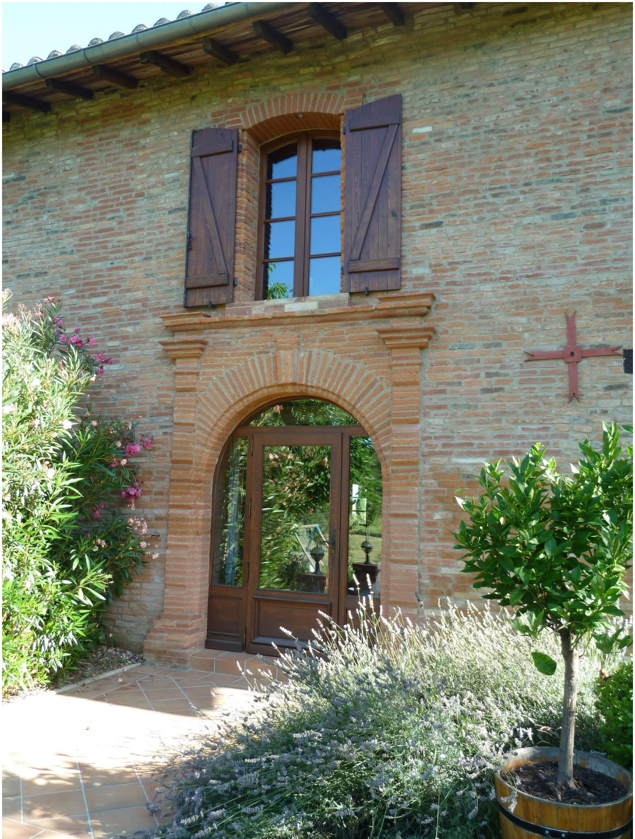
Fig. 9 : Vestiges de l'abbaye de Goujon, ancienne abbataiale ?, le portail sud d'époque moderne.