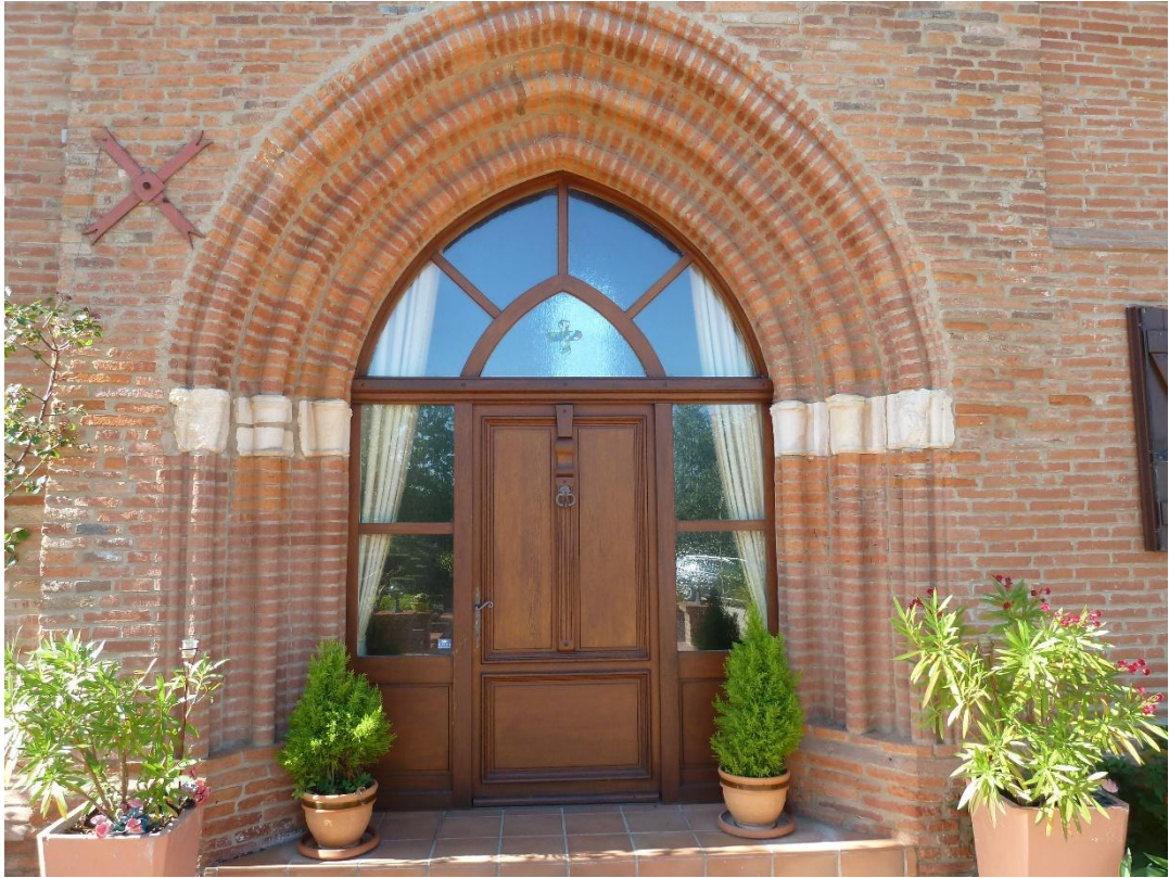
Fig. 10 : Vestiges de l'abbaye de Goujon, ancienne abbatiale ?, le portail nord.