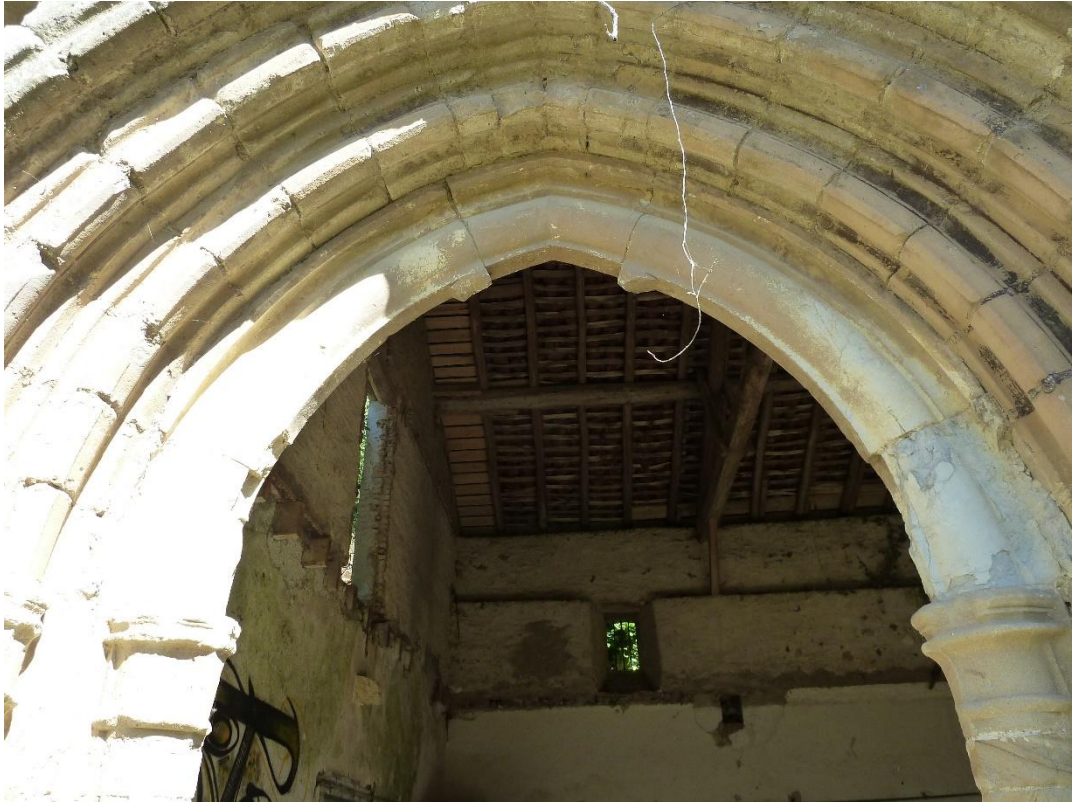
Fig. 16 : Les Bordes-sur-Arize, ancienne abbaye des Salenques, détail de la façade occidentale de la salle capitulaire.