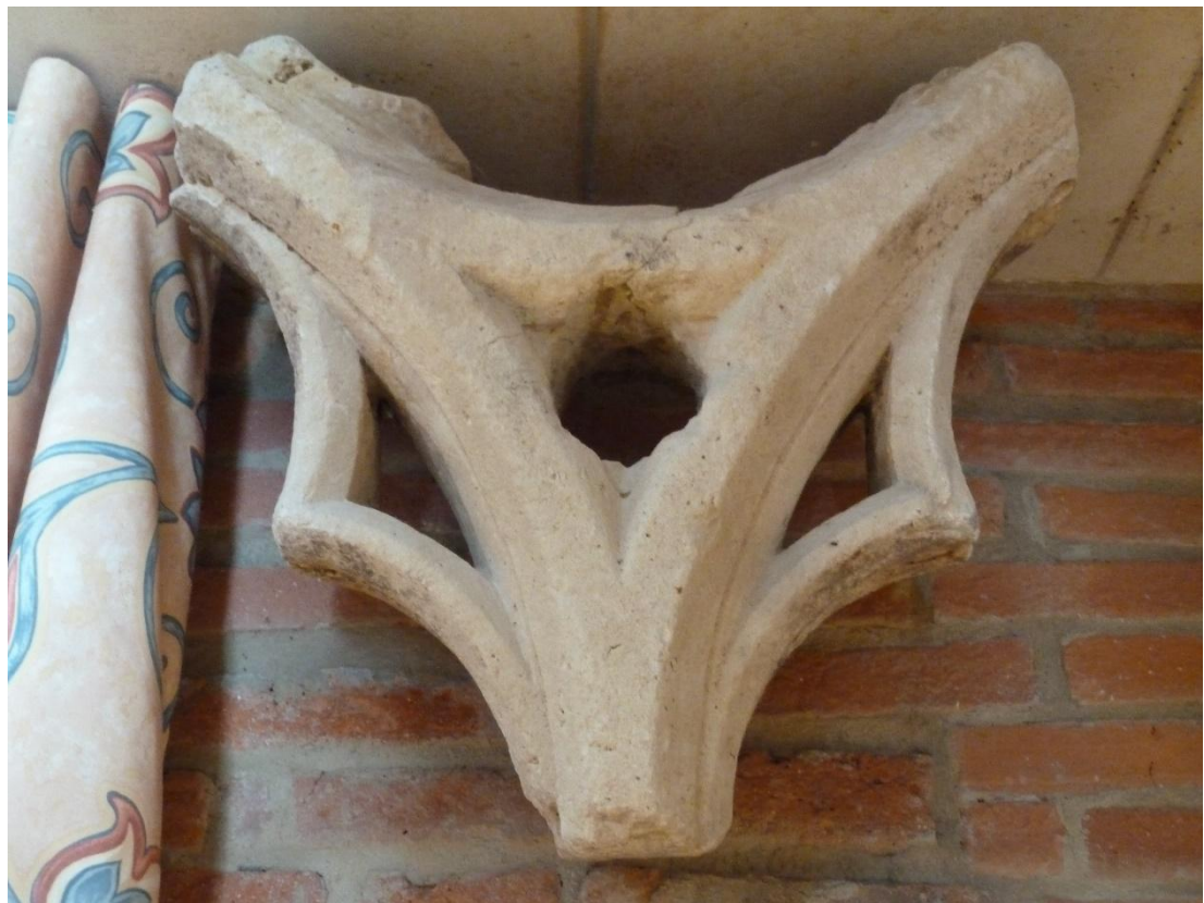
Fig. 15 : Vestiges de l'abbaye de Goujon, l'élément de remplage gothique.