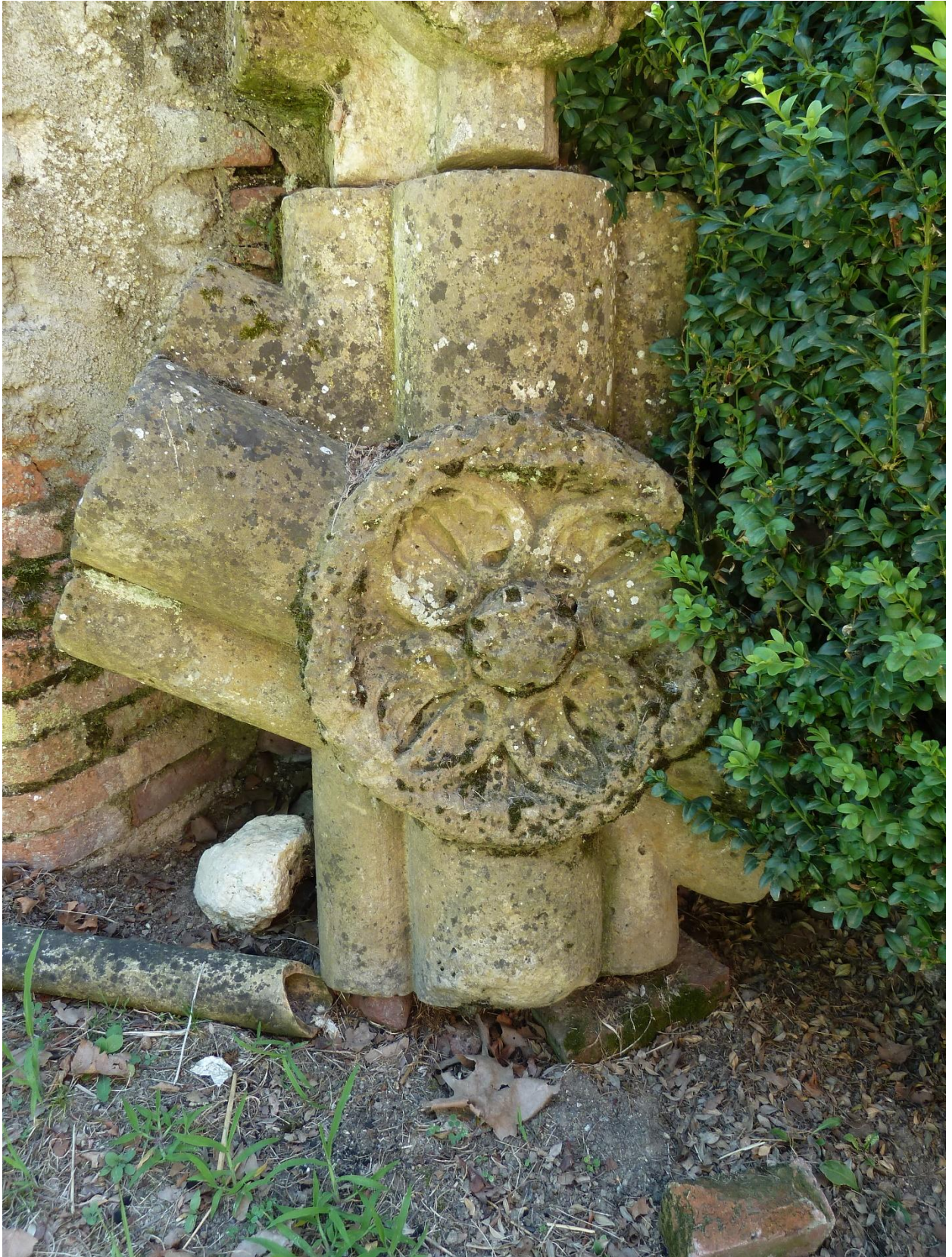
Fig. 6 : Vestiges de l'abbaye de Fabas, clef de voûte 3.