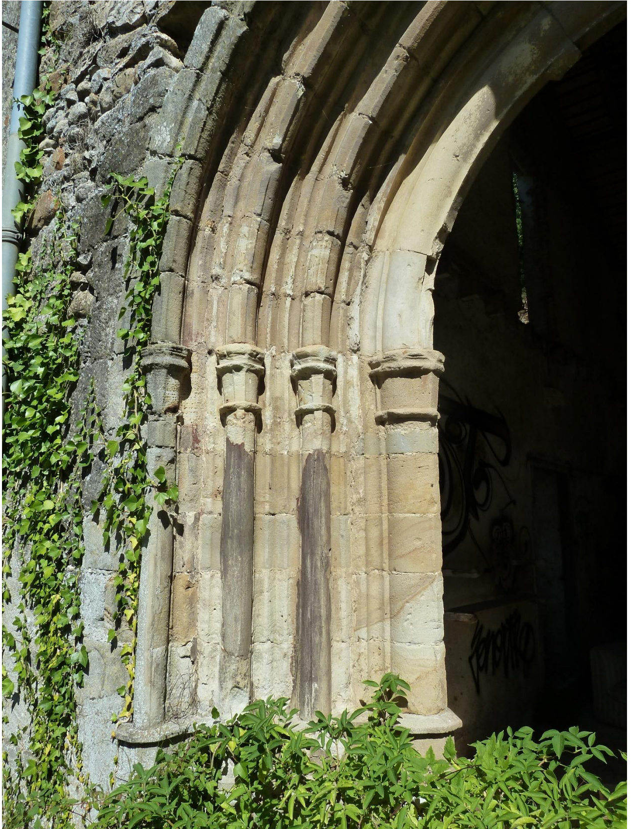
Fig. 11 : Les Bordes-sur-Arize, ancienne abbaye des Salenques, détail de la façade occidentale de la salle capitulaire.