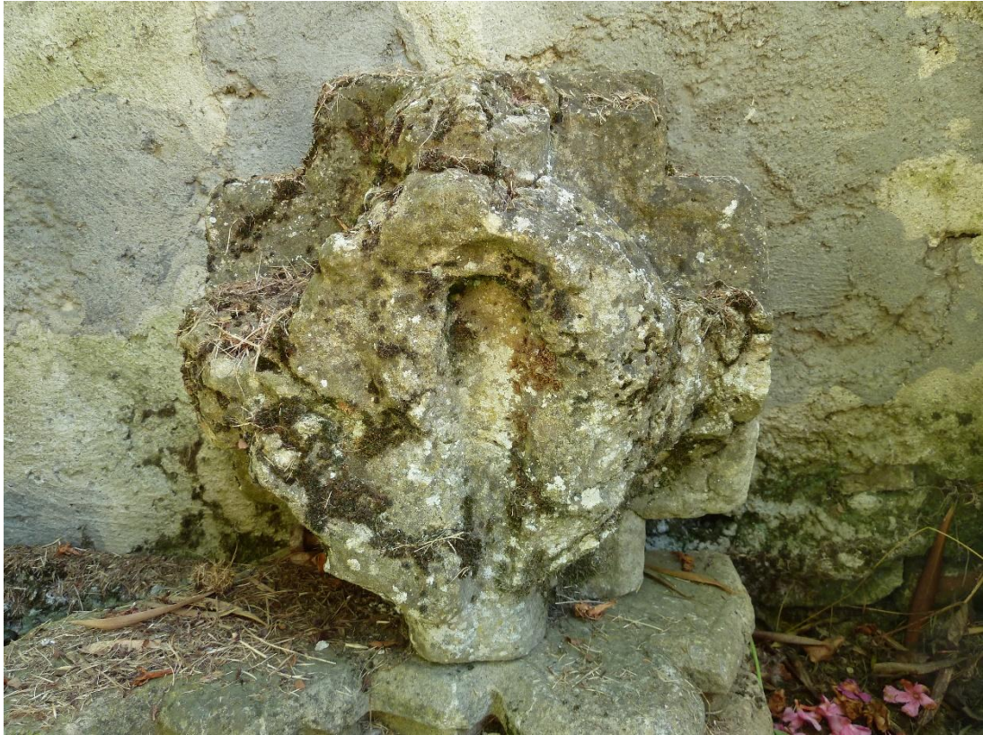
Fig. 4 : Vestiges de l'abbaye de Fabas, clef de voûte 1.