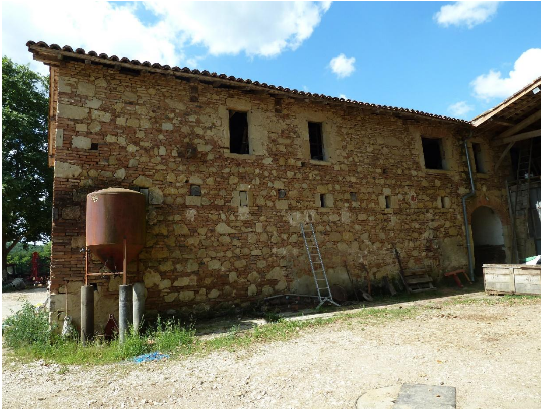
Fig. 1 : Fabas, « Au Couvent », le bâtiment agricole.