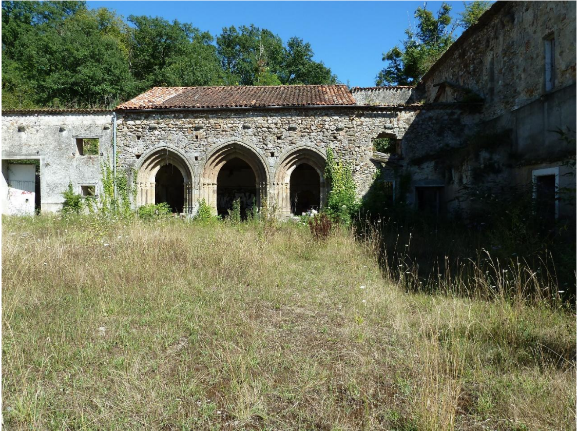
Fig. 19 : Les Bordes-sur-Arize, ancienne abbaye des Salenques, vue partielle, depuis l'ouest, de l'aile orientale des bâtiments monastiques.