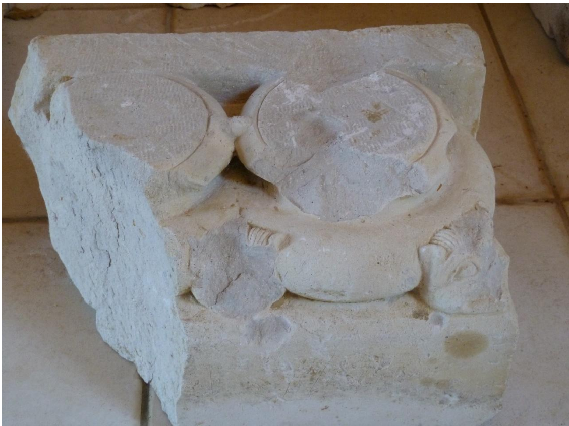
Fig. 13 : Vestiges de l'abbaye de Goujon, la seconde base double.