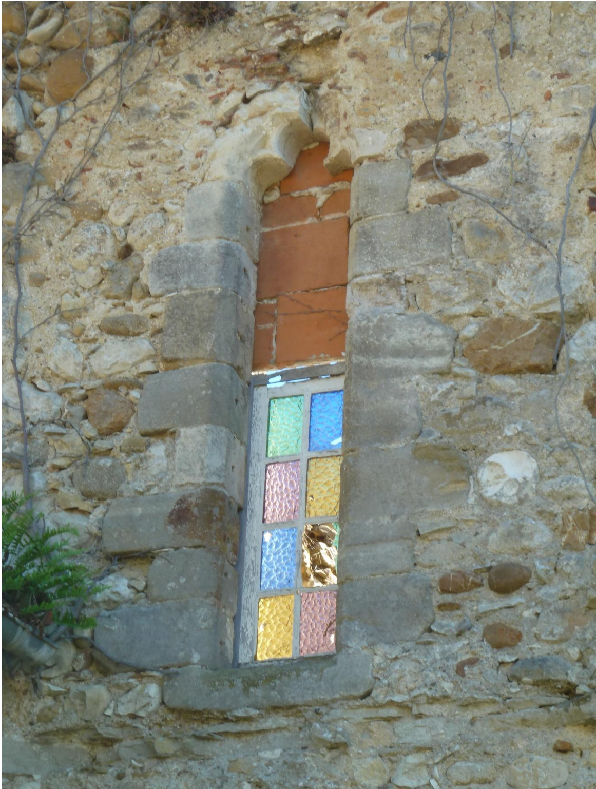
Fig. 18 : Les Bordes-sur-Arize, ancienne abbaye des Salenques, mur nord de l'ancienne abbatiale, détail.