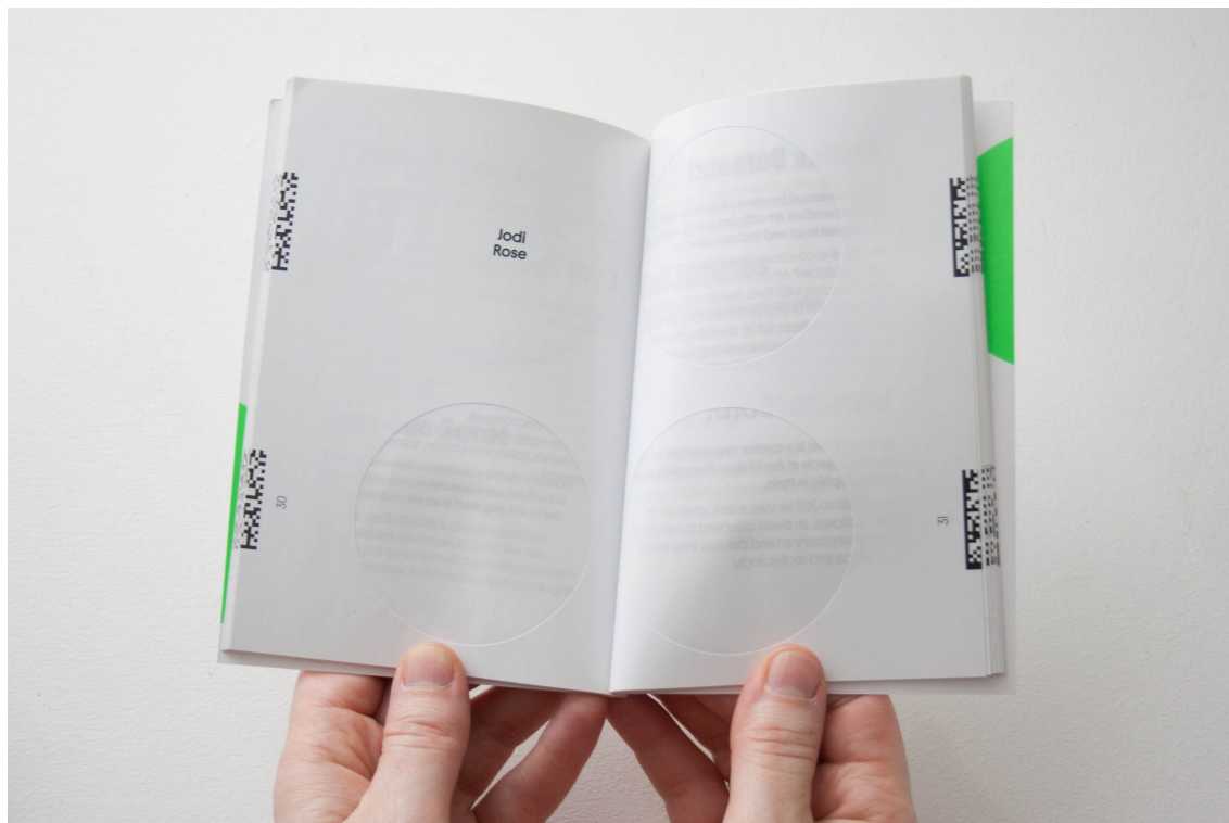
Figure 2 : Les traces laissées par les QR Codes dans le carnet

mettre à jour les œuvres est une façon de prolonger, et de conserver, l'exposition. Paradoxalement, l'un des rôles du commissaire – et de l'éditeur – est de s'assurer de la pérennité du projet : ils doivent faire en sorte de maintenir le contenu numérique aussi longtemps que possible. D'où la demande faite aux artistes de fournir les fichiers des œuvres dans la meilleure définition possible, dans des formats standards ou encore dans l'usage pour l'interface de langages de programmation et de bibliothèques largement documentés et maintenus (html, javascript, jQuery).