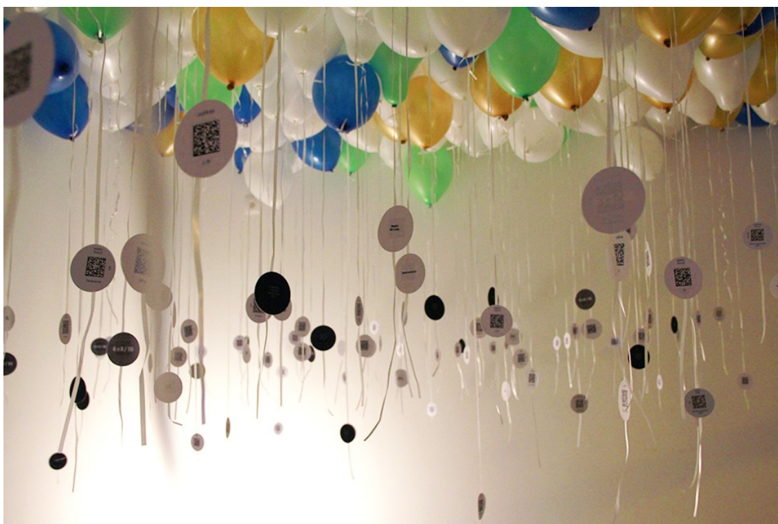
Figure 3 : Galerie Up, Bruxelles, 9 novembre 2013 : vue générale de l'exposition avec les QR Codes accrochés aux ficelles des ballons.

the on-line space for museum informatics », s. d.) 5 . Le visiteur peut garder la trace de son propre parcours de visite, des œuvres qu'il a préférées, des informations qu'il a consultées en ligne grâce aux cartels augmentés, partager son regard avec ses amis ou d'autres visiteurs, prolonger l'expérience de l'exposition dans le musée par l'exposition virtuelle, imprimer le catalogue de sa sélection d'œuvres, etc. Le phénomène du commissariat délégué se retrouve à la croisée de l'exposition et de la publication, du réel et du virtuel. Il permet l'appropriation des contenus par le public et la personnalisation de la visite à l'heure des pratiques culturelles numériques caractérisées selon Laurence Allard par leur « singularité, expressivité et remixabilité » (Allard, 2009). Le visiteur produit le lien entre les œuvres, définit l'ordre et le contexte de rencontre. Le rôle du commissaire est de proposer une présélection, un contexte plus global avec différentes possibilités d'exploration, de confrontation qu'il n'a pas toujours envisagées.