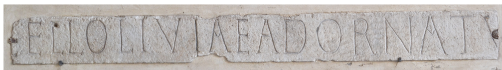
Fig. 1 - CIL, VI, 1178, dans le mur droit du portique de Santa Maria in Trastevere, Rome