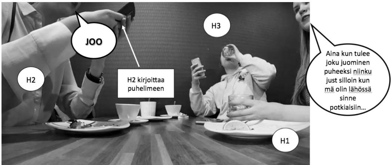
Kuva 3. Laitetta käyttävä pysyy minimipalautteiden avulla keskustelussa mukana

Suomen kielessä dialogipartikkelin “joo” käyttäminen nähdään usein joko kuulijaksi asettautumisenä, samanmielisyyden osoittamisena tai keskustelusekvenssin päättämisenä (Sorjonen 2001). Esimerkissämme “joo” osoitti erityisesti kuulolla oloa, sillä Henkilö 2 kirjoitti koko ajan samanaikaisesti jotain älypuhelimellaan peukaloitaan käyttäen. Samalla esimerkistä voi nähdä medialaitteen tahmeuden, kun joo-partikkelit eivät osukaan ”siirtymän mahdollistaviin kohtiin”, joiden yhteydessä ne yleensä esiintyvät. Tavallisesti partikkelit ovat siis sellaisissa kohdissa, joissa puheenvuoro voi vaihtua toiselle henkilölle ja joita yleensä edeltää pieni tauko, mutta tässä esimerkissä Henkilö 2 tuottaa joo-partikkelit ”ohi” niiden tyypillisistä esiintymiskohdista. Tämän voi nähdä ilmentävän sitä haasteellisuutta, joka seuraa vuorovaikutuksesta kahdessa eri temporaalisessa järjestyksessä: samaan aikaan kun Henkilö 2 pitää joo-lausumillaan yllä osallisuuttaan keskusteluun, hän ei kuitenkaan aivan kokonaan ole tämän osallistumiskehikon käytettävissä.