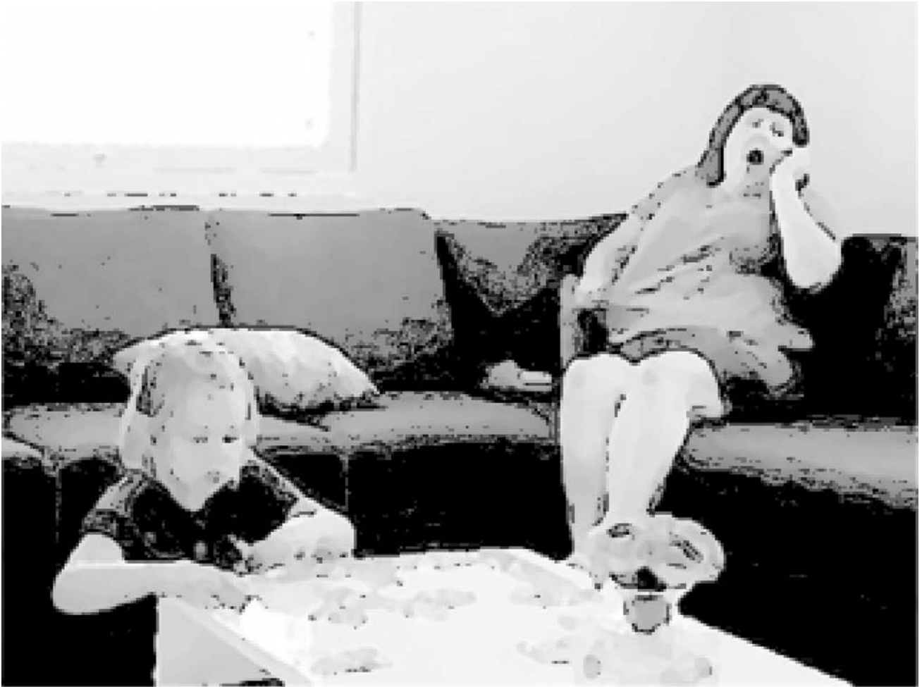
Kuva 1. Äiti aloittaa puhelinsoiton

Aineisto-otteen aikana tyttären katse on palapelissä ja äiti istuu viistosti hänen takanaan sohvalla. Niinpä tytär ei ole huomannut, että äiti on ottanut sohvalla vieressään olleen kännykän käteensä ja aloittanut puhelun (Kuva 1). Tyttären toistuvat avunpyynnöt äidille tulla auttamaan häntä palapelin kokoamisessa ja äidin kieltäytymiset ovat luoneet tietynlaisen yhteisen jatkuvan toiminnan kehyksen tyttären ja äidin välille. Myös heidän kehollinen sijoittumisensa tilaan, lähelle toisiaan, ja tässä