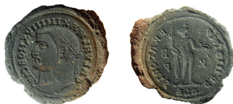
Fig. 2: Exemple de moule monétaire portant les empreintes de deux nummi du IV e siècle (Römisch-Germanisches Zentralmuseum O.33377. Clichés J. Chameroy).